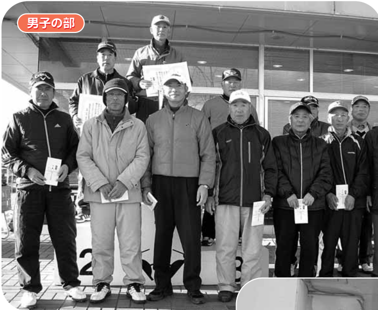
【第3回社協会長杯 パークゴルフ大会】