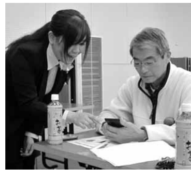
▲「もしもの時は、このボタンで繋がりますか?」

また、実際に自分の携帯電話を使って、災害伝言板の安否情報の登録や確認の体験を行いました。皆さんは、日頃、使用する事が出来ない機能という事で、操作方法を質問しながら、熱心に取り組んでいました。