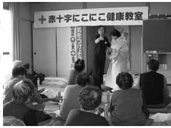
毛布を利用したガウン作り