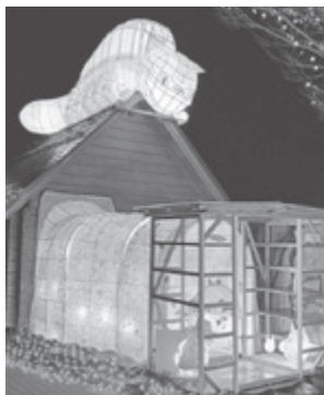
▲「おだか」ゆきネコバス まさにファンタジー