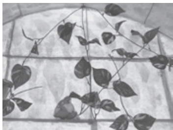
▲ トトロの森が再現されています