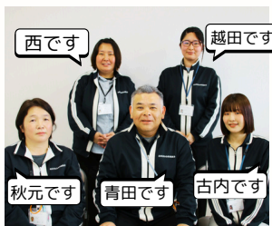
▲生活支援コーディネーターの5名