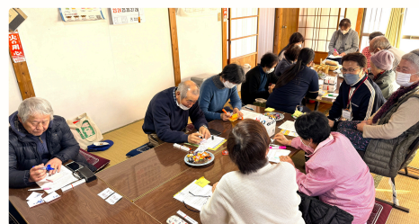
▲小地域福祉懇談会で地域のお宝探し（自慢）

3区で活動ができるようになり、見えてきた地域のお宝を、皆さまにお伝えできればと『SCお宝通信』の発行を決めました。ぜひ各地域の活動をご覧ください。