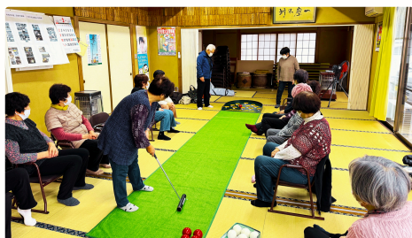
▲スカットボールの後は、皆でお茶タイム♪

浮田地区に住んでいる高齢者や1人暮らしの方に外出の機会を！ということでサロン活動を開始。無理なく参加できるように、月1回の開催にしています。参加された方が楽しく過ごせるように、役員さんが毎回内容とお茶菓子の工夫をしているそうです♪