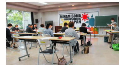
▲ひがし地区福祉委員会の総会 今年はどんな交流会にしようかな？

原町区には、9地区の福祉委員会があります。地区福祉委員会は、その地区がより良くなるために、地域の見守りや交流会などを行っています。会議の中ではサロン立ち上げについて話し合ったり、今年度の事業計画などを行っています。地域の方は、毎年交流会を楽しみにしていると話していました♪