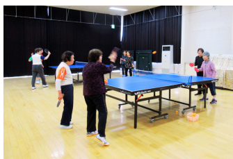
▲石神生涯学習センター スマッシュ決めるわよ！チョレイ！

地域の交流の場の1つとして、生涯学習センターがあります。地域の方がサークル活動を行っていて、スポーツや手芸など様々な分野があり、皆さん和気あいあいと楽しまれています。皆さんのお住いの地域にも、サロンやサークル活動などあると思います。今後も活動の場へおじゃましてこの通信で紹介していくので、よろしくお祈りします♪