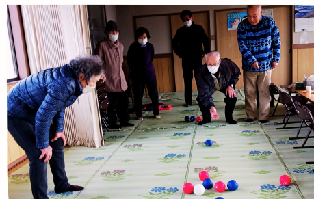
▲女性チームと男性チームに分かれていざ勝負！