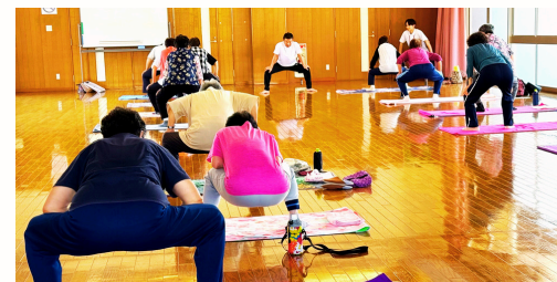
▲健康体操で心も身体もスキット！