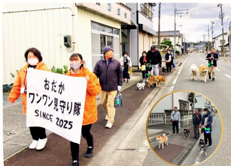
▲みんなでパレードをしながら見守り活動

当日は登録の約半分にあたる14頭の隊員が出席し、地域包括支援センター職員による講話のあと、パレードへ出発。愛犬家同士ワンちゃんの話が絶えず、賑やかな出発式になりました。これからもそれぞれの場所で、地域の見守り役として活動します。