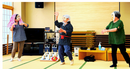
▲ひょっこり踊りをみんなで披露♪

月2回スキット千倉の講師に来ていただいて、無理なく行える健康体操を教わっています。自宅でもできる内容なので、参加者さんはサロンがない日も継続して実践しているとのこと。なので、皆さんとても若々しくてはつらつとしています☆