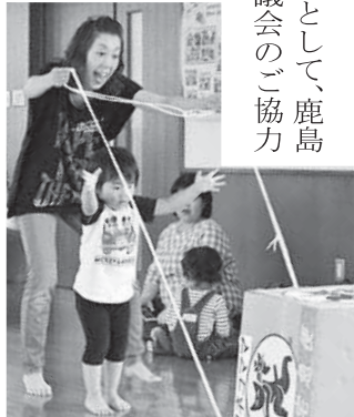
▶ お母さんと力を合わせて!

参加者は、「梅雨に入って、体を動かす機会が少なくなっていたので良かった」と喜んでいました。