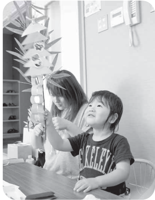
◀「僕の飾り付け、かっこいいでしょー！」（七夕飾り作り）