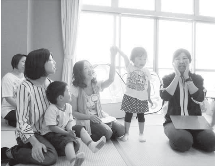
▲毎回、元気な子どもたちが参加してくれています