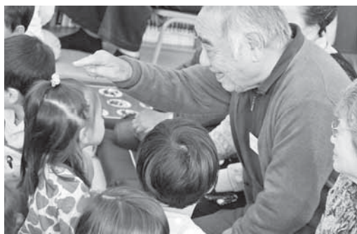
▲幼稚園児との交流に笑顔(昨年度の様子)