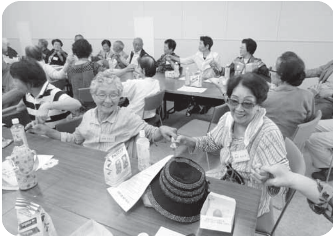
▲参加者同士で手を握り合って交流