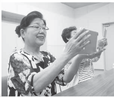
▲楽しくタブレットを学びました

初めて、タブレットに触れるという方が多く、テレビ電話・地図アプリ・カメラ機能・電子書籍・インターネットなどが、指先一つで出来ることに加え、音声認識機能も搭載されたタブレットに、驚きの声が上がりました。参加者からは、「指だけでなく声でも動かせるので驚いた!」「これをきっかけに、タブレット