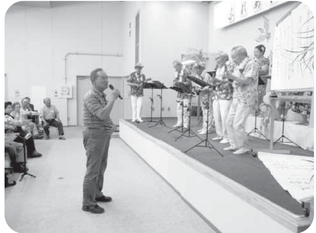
▲ウクレレの演奏に合わせて歌声を披露♪

7月9・10日に原町区福祉会館で、高齢者ふれあい交流会(七夕会)を開催しました。 原町区内に住んでいる70歳以上のひとり暮らしの方や高齢者世帯の方を対象に、合わせて235人が参加しました。会場には、大きな七夕かざりを付け、参加者がそれぞれ願い事を書いて飾りました。 また、参加者は、北町保育所の園児による歌とお遊戯を見たあとに、素敵なプレゼントをいただきました。 「笑って爽快 no-no-nahana!」の皆さんによる笑いヨガと健康体操では、大きな声を出して笑ったりして楽しみました。午後からは「アロハ・ウクレレ」の皆さんによる演奏や歌を聞き、一緒に歌を口ずさみ、会場は大変盛り上がりしました。 運営には、原町ボランティア連絡協議会、原町赤十字奉仕団、各地区の民生委員の皆さんに、お手伝いいただきました。