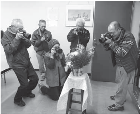
▲昨年度の様子 皆さん、真剣にシャッターを押していました。