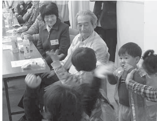
▲園児のかわいい姿に笑顔