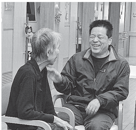
▶笑顔も大切ですね！

今後、地域の皆さんの声を事業に反映させるため、地域懇談会の開催を予定しています。