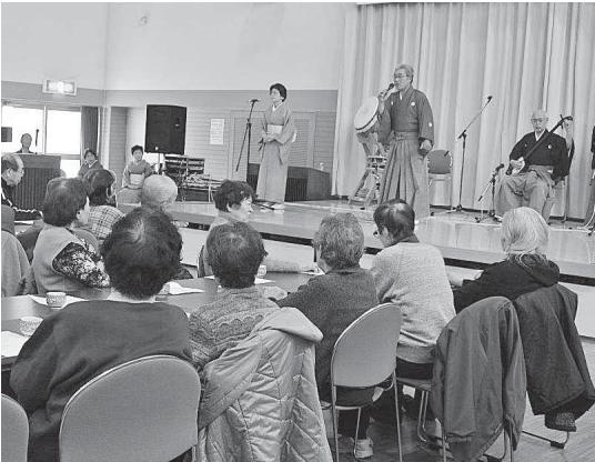
▲すばらしい歌声にほれほれ

最後に、ひまわり会から参加者に花苗が贈られ、思いがけないプレゼントに喜んでいました。