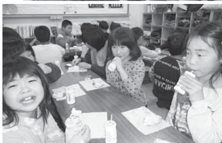
▲クリスマスケーキも食べました♪