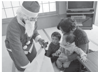
▲「やったー!プレゼントだ♪」

サンタクロースがプレゼントを持って登場すると、会場からは大歓声があがり、笑顔が溢れるクリスマス会となりました。運営は、鹿島民生委員児童委員協議会の皆さんが当たってくださいました。