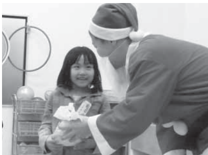
▶サンタさんありがとう!