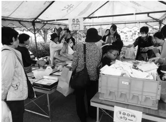
▲チャリティバザー

上真野小学校 八沢小学校 太田小学校 石神第一小学校児童会 高平小学校児童会 原町第二小学校児童会 原町第三小学校児童会 原町第二中学校生徒会 小高工業高等学校 小高商業高等学校 原町高等学校