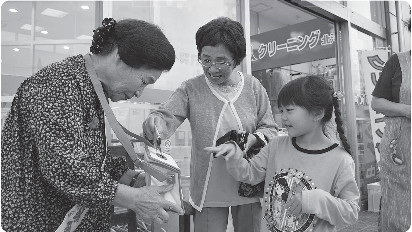
▲街頭募金運動の様子(平成27年10月1日)