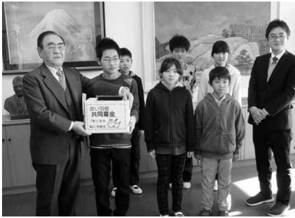
▲石神第一小学校児童会

ロイヤルホテル丸屋 鈴木税務会計事務所 石川建設工業(株) 庄建技術(株) ㈱福建コンサルタント社員一同 関場建設(株) 高野眼科医院 ㈱三恵クレア タニコー ㈱福島鹿島工場 タニコー ㈱福島原町工場 原町港湾運送(株)社員一同 (有)小谷津工務店 ステーシヨンプラザホテル 旭タイヤ商会 南相馬市役所各課・施設・小学校 南相馬市社会福祉協議会