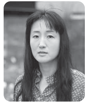
▲柳 美里さん