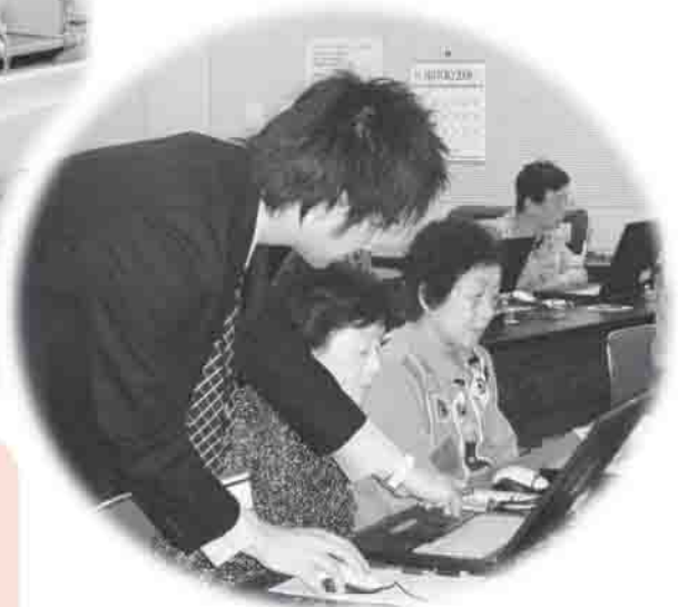
きれいに写ってますね (浮舟文化会館にて)

高齢者の生きがいづくりを目的とした「オリジナルカレンダー作り」の第1弾「デジカメ教室」、第2弾として「パソコンへの画像取り込み」を開催しました。どちらも初挑戦という方がたくさんいらっしゃいましたが、「おずかしい！」と口にしなながらも、ニコニコ顔で挑み手づくりの作品を仕上げました。