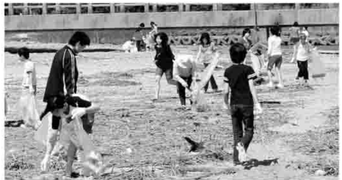
村上海岸にて海浜清掃

福祉少年団は6月10日、団員24名とボランティア協力員2名で小高区村上海岸の清掃活動を行いました。