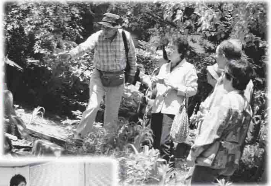
光と陰のバランスを見てください (コピスガーデンにて)