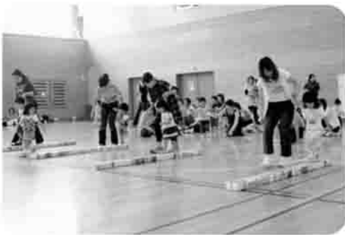
5/27 ままこんくらぶ「春の親子運動会」

公費の補助金や他の助成団体から活動助成金を受けている事業は、原則対象となりません。移動経費に対する助成については、福祉バス利用団体が助成対象にはなりません。当該福祉団体の活動趣旨にあった研修が対象になります。