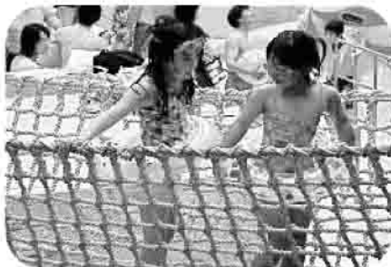
こっちに行くとプールだよ

親子揃って、南国気分でプールや温泉に入ったり、フラダンスをみたり、楽しい一時を過ごしました。