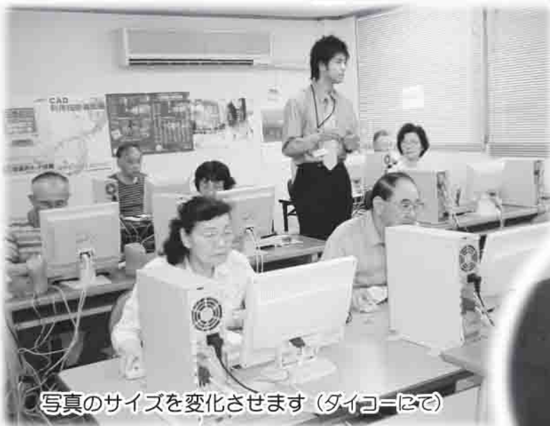
写真のサイズを変化させます (タイコ=にて)

高齢者の生きがいづくりを目的とした「オリジナルカレンダー作り」の第1弾「デジカメ教室」、第2弾として「パソコンへの画像取り込み」を開催しました。どちらも初挑戦という方がたくさんいらっしゃいましたが、「おずかしい！」と口にしなながらも、ニコニコ顔で挑み手づくりの作品を仕上げました。