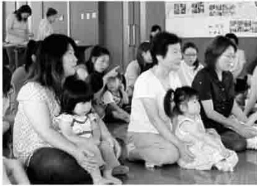
紙芝居たのしいね

なかよし親子たなばたおはなし会を7月7日に、鹿島保健センターにて開催しました。南相馬市内の未就学児親子32名が参加し、たなばたの音楽にあわせて体を動かしたり、紙芝居を楽しみました。また、ボランティアさんの手づくりのあんみつを一緒に食べながら交流を深めていました。