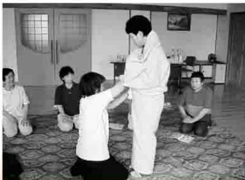
◀ 毛布を使ったガウンの仕方

受講者は、いつ身近に起こるか分からない災害時の対応について、熱心に受講していました。