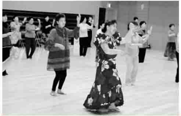
ウクレレを鳴らすポーズ

昨年の人気に応えての企画でしたが、今年も大勢の方々が参加されました。曲目は「月の夜は」で最初にステップを練習し、次に振りを習いました。短い時間でしたが、みなさん完ぺきに踊れるようになりました。