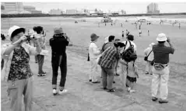
どこを撮りますか?

5月に開催した事業が好評だったため、8月18日に「第2回デジカメ教室」を原町区福祉会館にて開催しました。