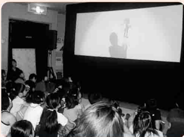
みんな、真剣に影絵人形劇を見てます！