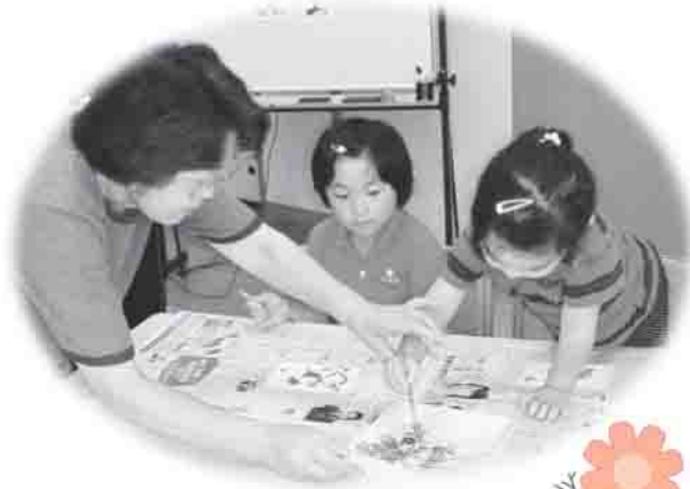
▲表情も真剣そのもの!