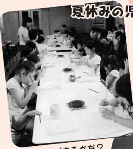
うまくできるかな？