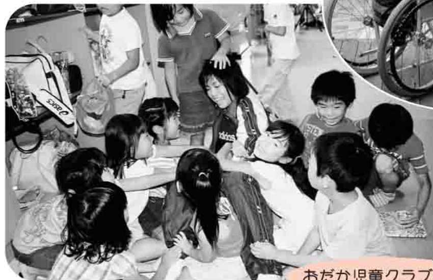
おだか児童クラブにて