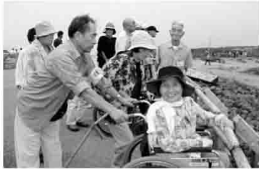
きれいな景色だね♪

ふれあいと生きがい遠足事業(鹿島区内障がい児者対象)は、8月1日に蔵王エコーラインと宮城県川崎町みちのく杜の湖畔公園に行きました。