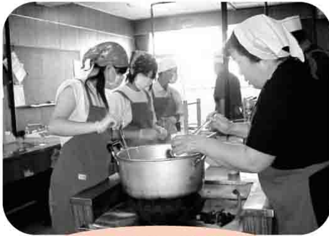
鹿島区配食サービス事業の調理ボランティア