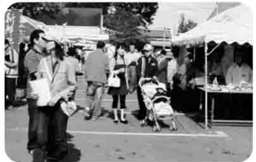
昨年は、大盛況でした!

平成20年度南相馬市健康福祉まつりを、10月18日(土)・19日(日)にサンライフ南相馬周辺の施設・屋外で開催し、15団体が参加します。 「出会い、ふれあい、支えあいく福祉の南相馬へ」をテーマに、各福祉団体等による出店・販売コーナーや、映画の上映、屋外イベントでは市内の子どもたちの演奏会やおゆうぎなど、たくさん楽しい催しを計画しています。 社会福祉協議会では、『まごころ食堂』を出店し、おいしさ満点のうどん、きのこ弁当、むしパンを販売します。どうぞ楽しみに来てください。