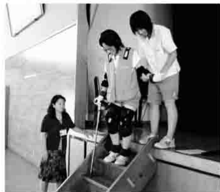
足もとを確認してね

持って、階段の昇降やパズル、パジャマのボタンしめなど高齢者の方の疑似体験に挑戦しました。肘や膝の関節が動きにくくなるサポーターもつけたことにより、高齢による動作の大変さを体感していました。