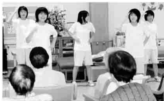
楽しいレクリエーション!

5人とも初めての経験でしたが、みんな素直で一生懸命に利用者さんのお世話をしている姿がとても印象的で、利用者さんも大変喜んでいました。