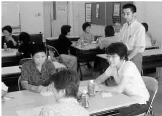
グループワークにて