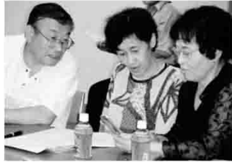
真剣に伝言板へかきこみ

最初に、音声で登録する「災害用伝言ダイヤル171」の利用を体験し、次に携帯電話の「iモード災害用伝言板」へ挑戦をしました。参加者の半数近くが普段メールを利用していないため、文字の打ち方に苦労しましたが、みなさん協力しあって利用方法をマスターしました。講師から、先日の愛知県豪