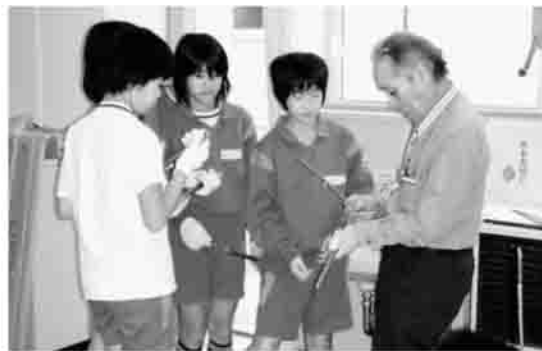
▲紙てっぽう うまく飛ぶかな？

その中でも、6年生は自分たちで育てた大小様々なジャガイモを使いけんちん汁を作りました。