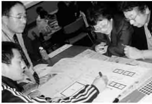
▶仮設トイレはどこに置く？

は市民、市役所・社協・消防職員をあわせて60名が参加しました。7人ずつのグループを作り、鹿島区の真野小学校及び体育館を避難所とした場合の居住空間や立ち入り禁止にすべき場所について図面に書き込みながら、開設方法やそれに伴う次の課題について検討しあいました。