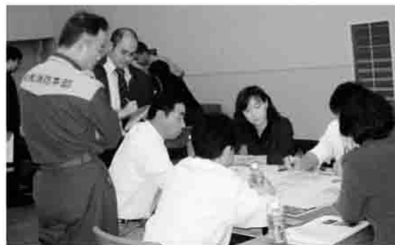
▶ガソリンスタンドに協力してもらおう

「飲み水や食事が足りない」「トイレの水が出ない」「1人あたりのスペースが狭い」など避難者から様々な要望や問い合わせが出され始め、このままでは市の職員だけでは対応しきれそうにない。このときどうする？