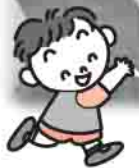
▲トンネル宝ひろい