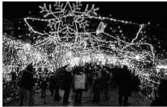
▶昨年度ふれあい広場にて