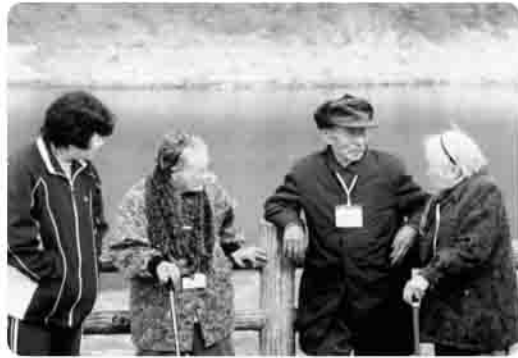
◀ 空気がきれいで気持ちいいなあ