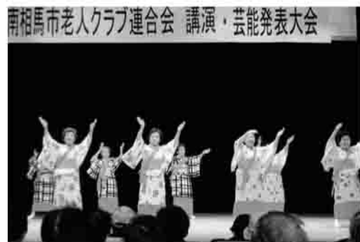
▲仲良会 (小高)「豊年こいこい」

その後は、各区の代表11団体が様々な踊りを披露し、最後にはコーラスグループと一緒に合唱し、楽しいひとときを過ごしました。