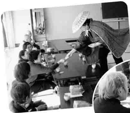
▲石神地区 ボランティアさんの寸劇