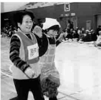
▲「うちの嫁さん」競技で