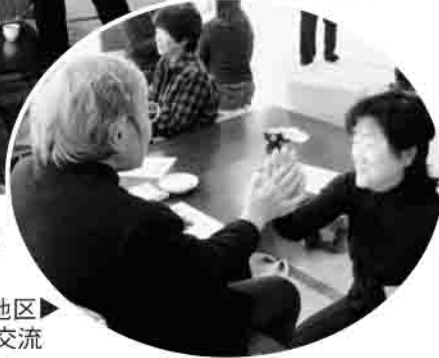
▶高平地区 ボランティアさんとの交流