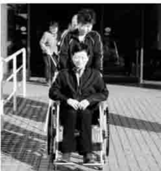
▲ 安全に誘導します

頻発するゲリラ豪雨などの例をあげ、すでに私たちが実感できるほど「地球は温まっている」という状況から、身近