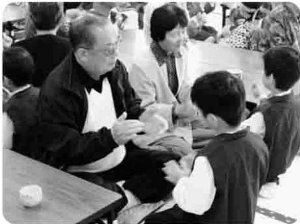
▲原町南地区 みなみ幼稚園児との交流

参加者のみなさんは、ボランティアの方々と一緒に講話を聞いたり、ゲームや折り紙などで交流を深め、おいしい昼食を食べて楽しく過ごしていました。