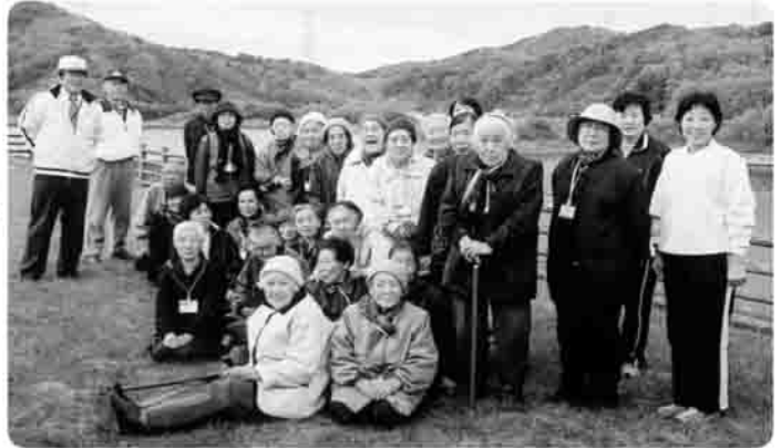
▶ きれいに撮ってね