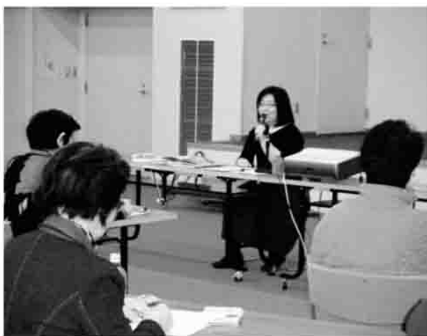
▲「子どもたちの夢…たくさんあります」