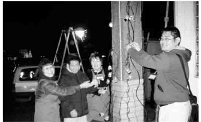
▲この電球を取りつければ完成!