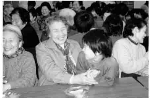
▲「おばあちゃん、いつまでも元気でいてね」

第82回ひとり暮らし高齢者のつどい（忘年会）を、12月10日に原町区福祉会館で、区内在住の70歳以上のひとり暮らし高齢者99人が参加し、開催しました。 原町あずま保育園の元気な園児たちのお遊戯を見たり、一緒に手遊びをして楽しいひと時を過ごしました。 昼食は、ボランティアの方々による手づくりお弁当が振舞われ、参加者のみなさんはいしそうに召し上がっていました。