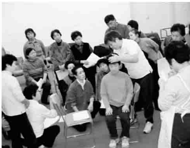
▲ぬくもりを感じてもらうことが大切です