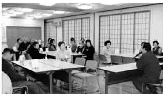
▲方言民話の世界に感動!

ある話に大笑いし、しんみりとした語り口に感動しました。会食を楽しんだ後、バスに乗り「あかりのファンタジーinおだか」を見学しました。約1時間かけてのバス旅行でしたが、初めてイルミネーションを見学した方もおり、きらびやかな夜の世界に一樣に感動している様子でした。