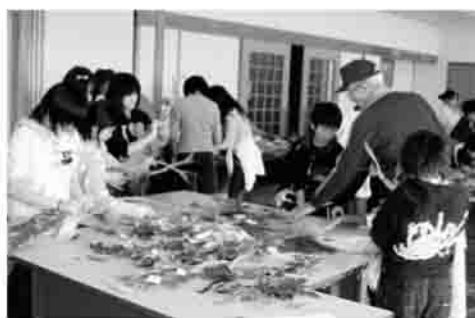
▲心をこめて作りました

小高区福祉少年団員22人が小高区内のひとり暮らし高齢者の方々へしめ飾りを贈るため、区内のボランティア7人の協力のもと、12月20日に小高老人福祉センターで、しめ縄の飾りつけを行いました。紅白のごへい、福扇、あすなる、柿などで飾られたしめ飾りは、地区の老人クラブの方々より友愛訪問の一環としてそれぞれ贈られました。