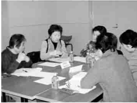
地域はみんなで見守っていかないと…

南相馬市福祉委員会連絡会を、3月6日に原町区福祉会館で市内10地区の福祉委員会を対象に25人が参加し開催しました。研修内容として2地区ずつグループを組み、「自分の地域で課題になっていることは何か」「それを解決するためには、どんな方法が考えられるか」などについて活発に意見を交換しながら、それぞれの活動について話し合いました。