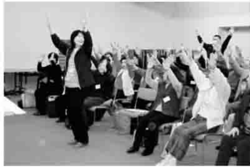
両手あがってますか？ ～ゲーム「合図にあわせて」～

地域で活動されているふれあいサロンの実践者を対象にした懇談会を3月5日に原町区福祉会館で開催しました。