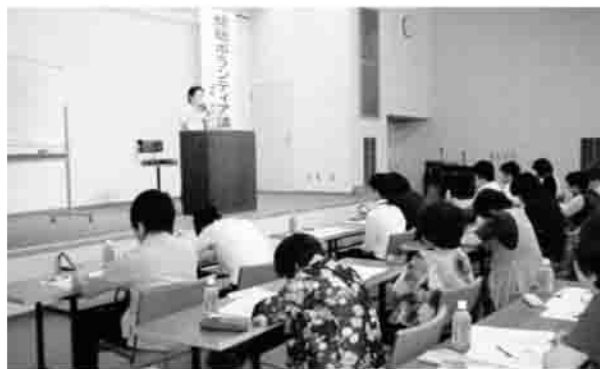
▲「心」を傾けて聴くことが大切

を損なわず受けとめること」「腕組みなどをせず、あなたの言葉を聞いていますよというメッセージとして頷きやあいつちが大切であること」などを学びました。