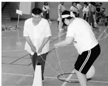
▶わんちゃんとおさんぽ

「第37回おひさまといっしょに」が7月11日に、小川町体育館で開催されました。市内の心身障がい児者や高校生ボランティアの方々など310人が参加し、市のシンボルにちなんだ「さくら」「けやき」「さけ」「ほたる」の4チームに分かれ、「クリン作戦」「わんちゃんとおさんぽ」などのユニークな9種類のゲームを競い、心地よい汗を流しました。