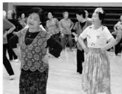
▲楽しく踊りませんか？