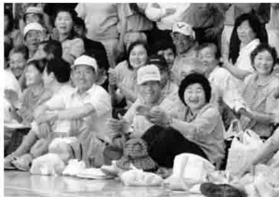
▲ガンバレ♪ガンバレ♪