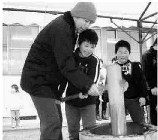
▲小高区金谷行政区

○地域間三世代交流事業、地域福祉事業の申し込みについては下記までお問い合わせください。