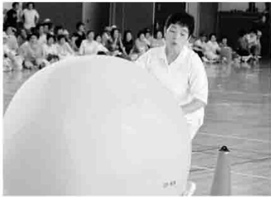
▲蟻さんの玉転がし

「第4回原町区高齢者スポーツ大会」が、6月26日に南相馬市スポーツセンターで開催され、891人が参加しました。会場内は、笑顔と歓声であふれかえり、スポーツを通じてチームを超えた親睦や交流を深めることができました。今年、石神北チームが、3年連続優勝を目指す大甕チームをおさえ、見事！優勝しました。