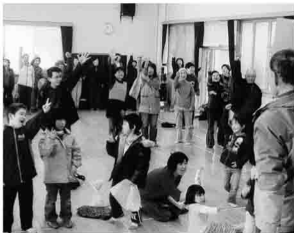
▲原町区下北高平行政区