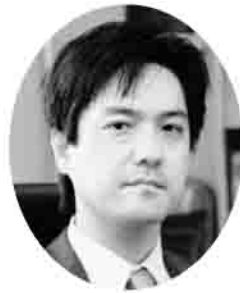
若杉裕二法律事務所