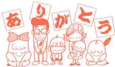
▶フレスコキクチ東原町店前にて