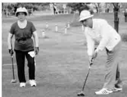
▲皆さん、はつらつとしたプレーをしていました。

第1回社協会長杯パークゴルフ大会を、9月28日に牛島パークゴルフ場で開催しました。 当日は、あいにくの曇り空でしたが、270人のパークゴルフ愛好者が参加しました。 同組で回るライバル同士が励まし称え合いながら、「ナイスショット」と声を出