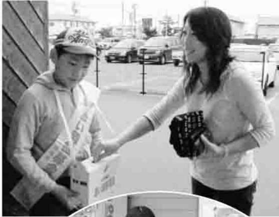
▶ダイユーエイト小高店前にて

なお、12月31日まで赤い羽根共同募金運動を展開していますので、皆さまのあたたかいご協力をお願いします。