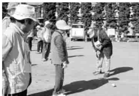
▲一打ごと歓声が起こっていました。