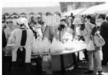
▲今年も大好評! ありがとうございます。

社会福祉協議会でもボランティアの方々協力のおかげで、今年も大好評! ありがとうございます。