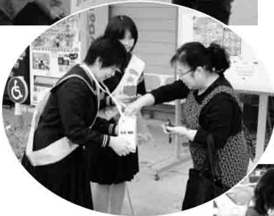
▶フレスコキクチ鹿島店前にて