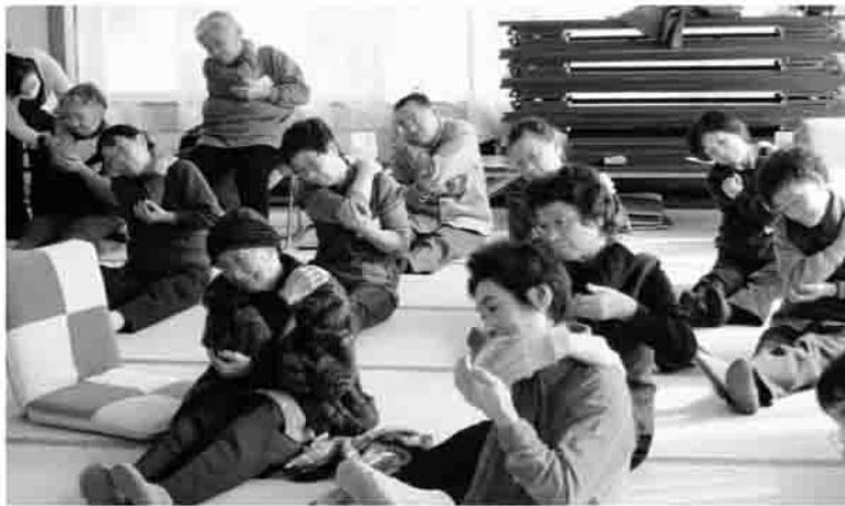
▲健康を保つには、体操が1番! (高平地区)