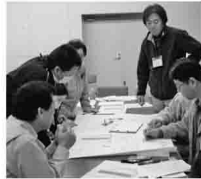
▲避難所の本部はどこに置く？

市民、市内の特別養護老人ホーム、老人保健施設、障がい者通所施設などの職員、市及び社協の職員合わせて31人が参加し、(株)社会安全研究所より3人の講師を招き、講義・演習を受けました。