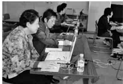
▶皆さん、真剣にパソコンに向かっていました。

色とりどりの写真が散りばめられた作品に、受講者は感嘆の声を上げて笑顔でお互いの作品に見入っていました。