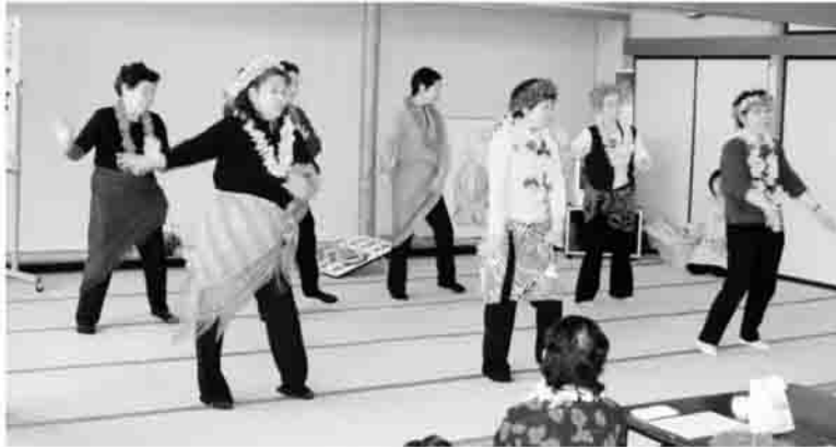
▲みんな一緒にフラガール♪ (石神地区)