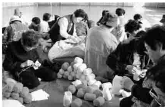
▶一つ一つ、心を込めて作りました。