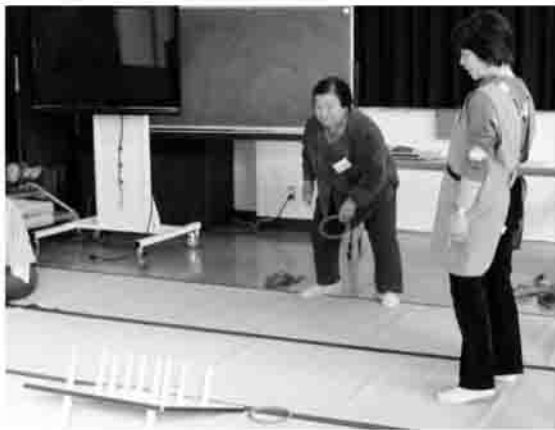
▲よく狙って投げてくださいね (太田地区)