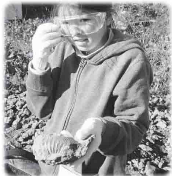
▲大きなアンモナイトの化石が採れました！