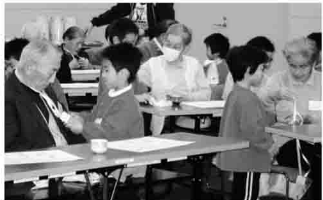
▲おじいさん、おばあさん、いつまでも元気でいてね (北町地区、仲町地区、本町・三島町地区)

原町区内のひとり暮らし高齢者(70歳以上)を対象に、「ふれあい交流事業」を原町区内7地区で開催しました。 参加者が住んでいる地域での開催のため、各々の特色を生かした