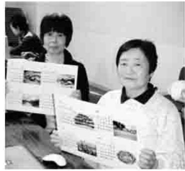
▲素敵な作品ができました

高齢者の生きがいづくりを目的に、「オリジナルカレンダー作り」を10月～11月に2回シリーズで開催しました。受講者が、デジタルカメラで撮った色鮮やかな花々や家族の笑顔、旅行先の景色などを使って、世界に一つだけのカレンダーを作り上げました。