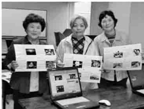
▶世界でただ一つのカレンダーです。

色とりどりの写真が散りばめられた作品に、受講者は感嘆の声を上げて笑顔でお互いの作品に見入っていました。