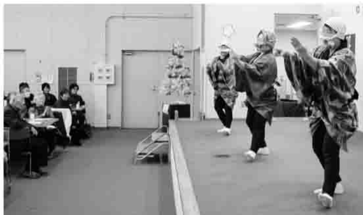
▶伝統芸能に見入っていました

露され、昼食には手作りのお弁当に舌鼓(したつづみ)をうちながら、有意義な時間を過ごしました。