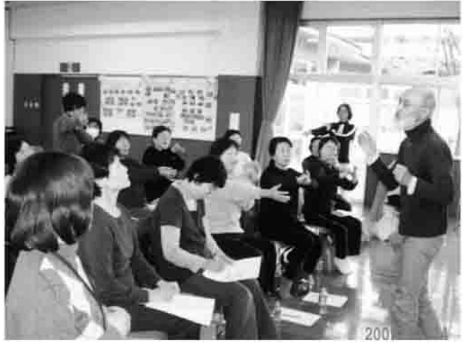
▲先生の、楽しい会話を交え、気軽に氣功を学びました