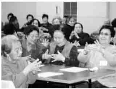
◀むずかしいなあ(指先の体操)

露され、昼食には手作りのお弁当に舌鼓(したつづみ)をうちながら、有意義な時間を過ごしました。