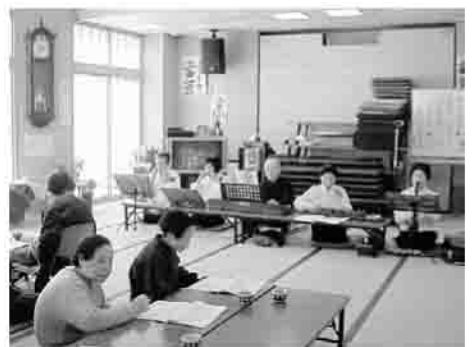
▲皆さん、懐かしいメロディーに浸っていました