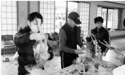
▶計140本を作りました

小高区福祉少年団員14人が、12月20日に小高老人福祉センターでしめ飾りづくりを行いました。 区内のボランティア6人に協力をいただき、作り方を教わりました。 しめ飾りの材料は、黒松、あすなる、柵な どで作られ、最初は慣れないようでしたが、コツを覚えると次々に完成させていきました。 プロ顔向けに作られたしめ飾りは、年内中に区内のひとり暮らし高齢者の方々へ届けられました。