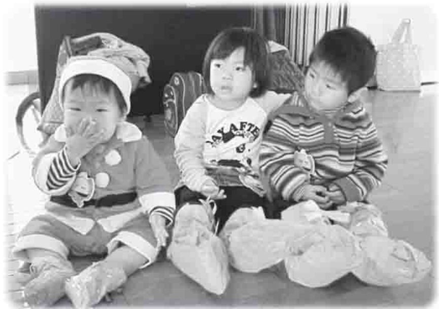
▲かわいい長靴の出来上がり♪