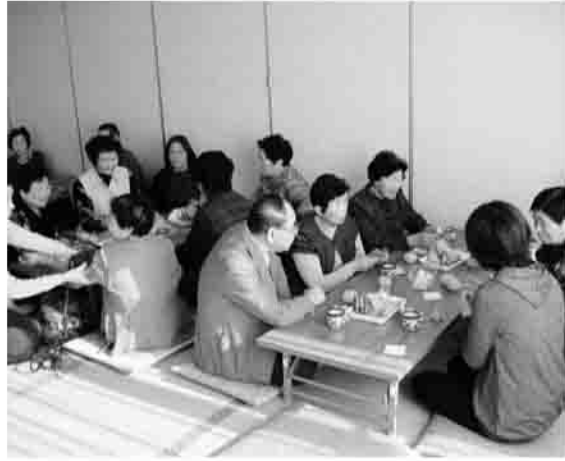
▲介護についての悩みなど、さまざまな話題が出ました。