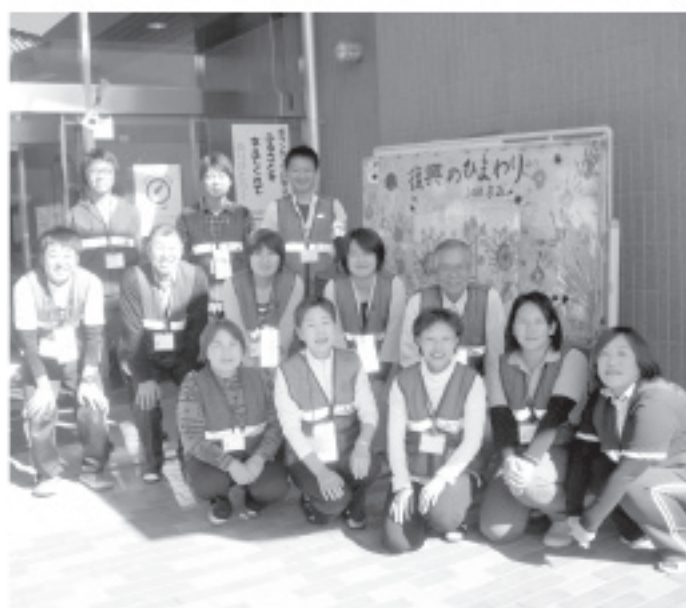
▲皆さんの元へお伺いします!