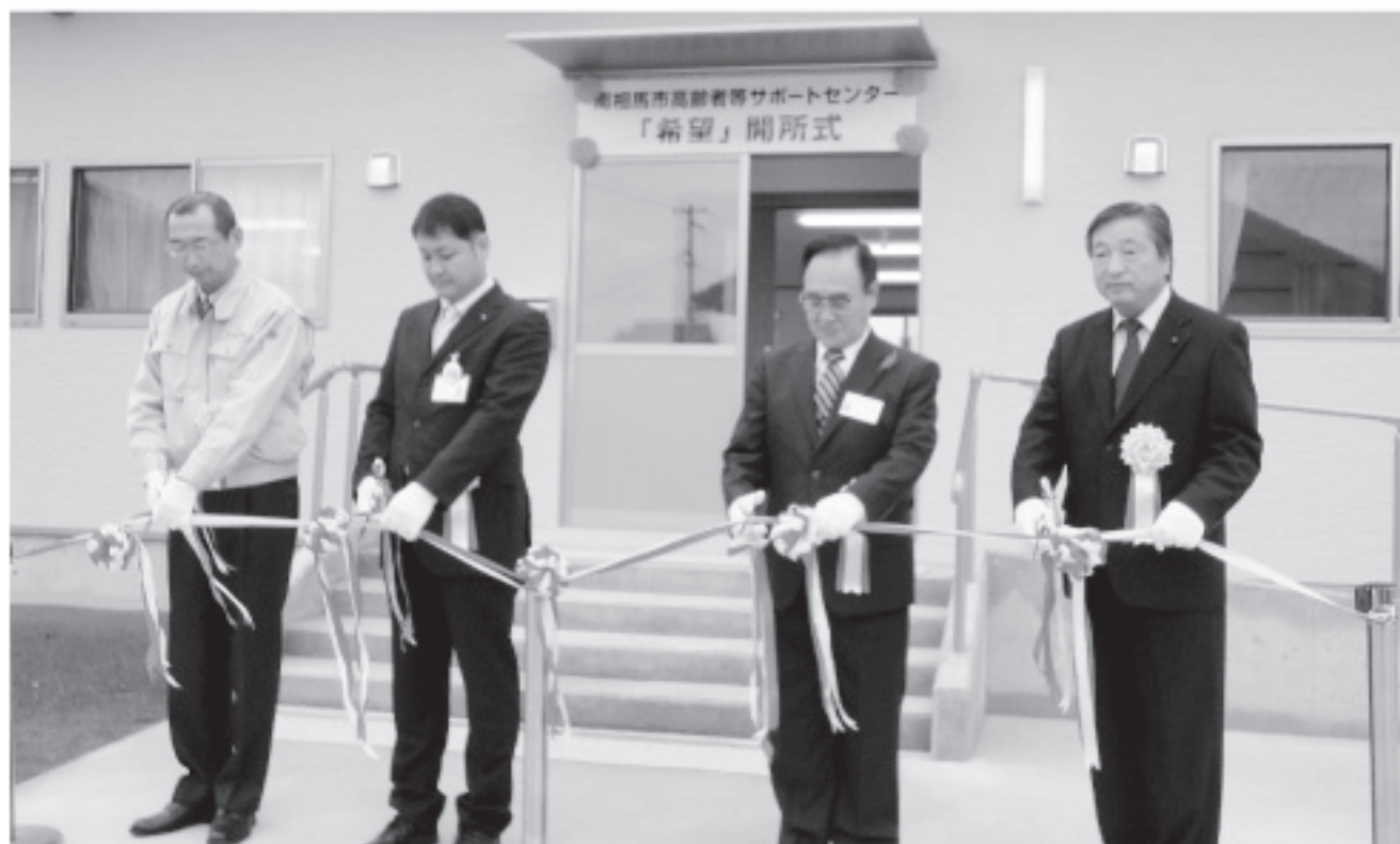
▲開所を祝うテープカット 地域の皆さんの「希望」となりますように！