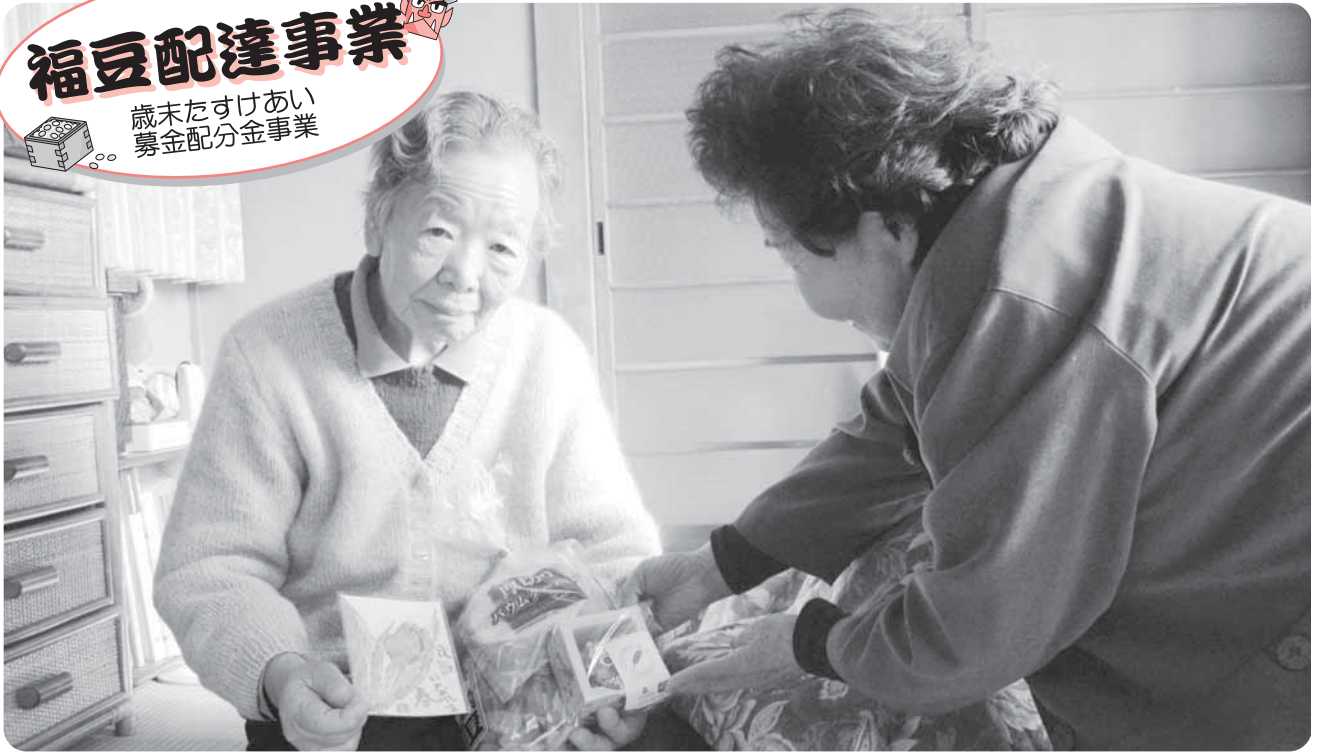
▲いい「福」が訪れますように

市内在住で、75歳以上のひとり暮らしの方約700人を対象に節分の豆などをお届けする「福豆配達事業」を、2月1日から3日に亘って実施しました。 配達には、各地区の民生委員の皆さんにご協力いただき、節分の豆に東京都の杉並区絵手紙文化連絡会の皆さんが描いた絵手紙を添えてお届けしました。