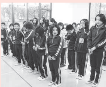
▲入館おめでとうございます!

入場する際、お父さん、お母さんが見守る中で、児童の皆さんは、ちよつと緊張した面持ちでしたが、一人ひとり名前を呼ばれると、「はい」と元気よく返事をしていました。