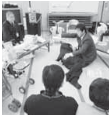
▲おむつ使用方法説明会