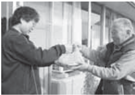
▲配達、よろしく御願います！

配達は、ボランティアの方にご協力いただき、まごころがこもったお弁当を各家庭にお届けいたします。