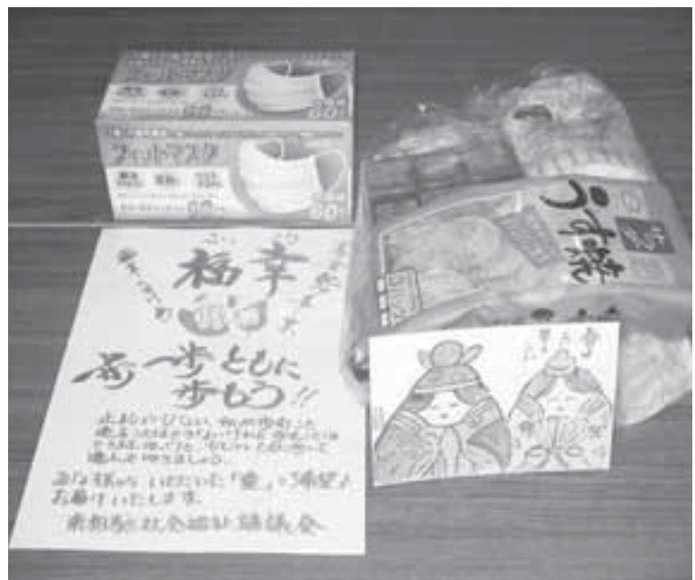
▲手作りの絵手紙とメッセージを添えてお配りしました

復興の元気につながることを願ってお届けした縁起物に、多くの方からの、笑顔をいただきました。