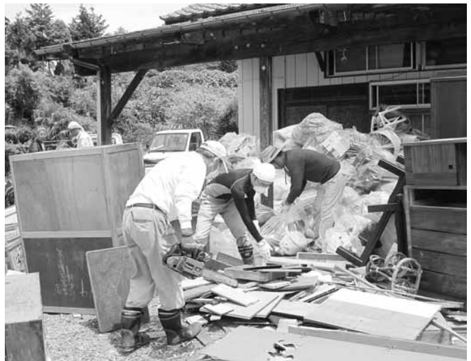
▲小高区での活動の様子