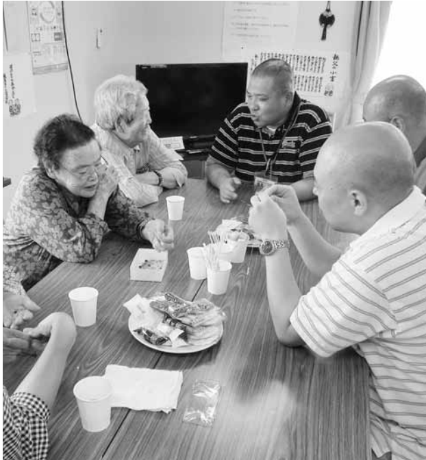
▲仮設住宅でのサロン（鹿島区）