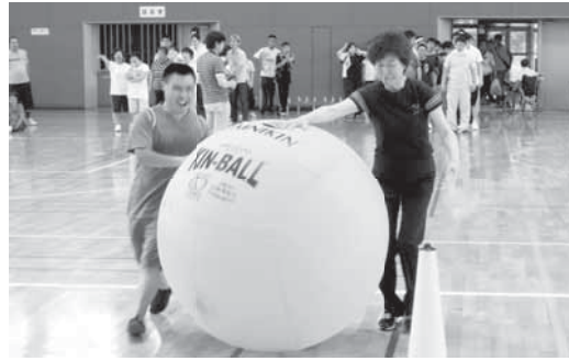
▲蟻さんの玉転がし