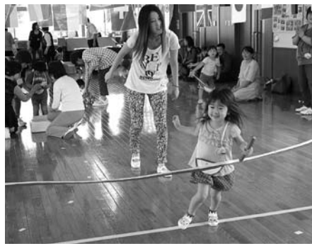
▲なかよし親子運動会