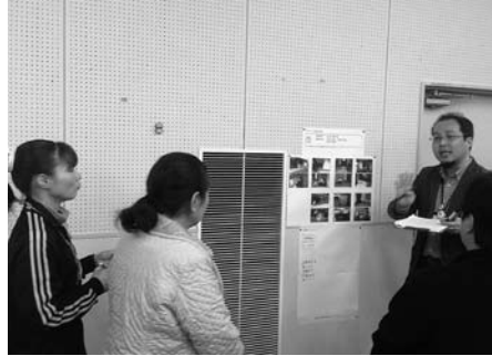
▲第4回ボランティアフェスティバル(災害ボランティア養成講座)