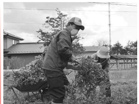
▲ボランティア活動のようす