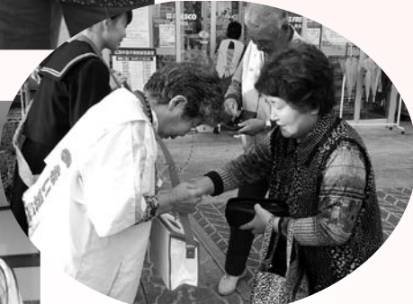
▲フレスコキクチ鹿島店