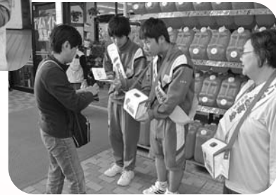
ダイユーエイト鹿島店▶