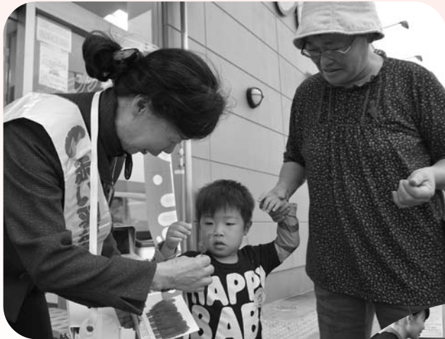
▲フレスコキクチ北町店

お寄せいただいた募金は、福祉施設やボランティア団体などへ配分されるほか、社会福祉協議会が行う各種事業にも配分され、地域で幅広く活用されます。