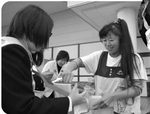
▲ヨークベニマル原町店