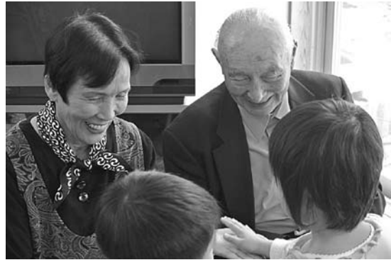
▲園児とのふれあいに笑顔

運営には、各地区の民生委員の皆さんにお手伝いをいただき、ボランティアを通して交流を深めていただきました。