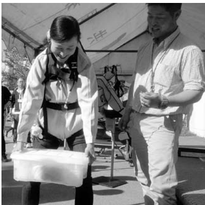
▲重い荷物も少ない負担で持てます