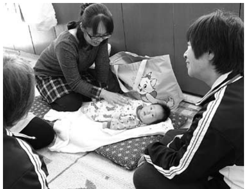
▶子育ての悩みもさまざま

ボランティアの方によるエステや全身マッサージで、日頃の疲れを癒してもらいました。子供たちは、フラダンスを踊ったり、会場を元気に走り回り、多くの笑顔が見られました。 また、子育て相談会や情報交換会も行い、参加者同士で子育ての悩みなどを話し合いました。