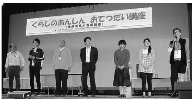
▲社協職員による寸劇で事業への理解を深めました

10月9日に、原町生涯学習センターで「くらしのあんしんおてつだい講座」を開催しました。 南相馬市民生委員児童委員連絡協議会、福島県社会福祉協議会との共催で、民生委員・児童委員、市民ボランティア、弁護士、司法書士、金融機関、福祉関係者など211人が参加しました。