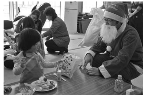
▲サンタさんにも会えますよ！（昨年度の様子）