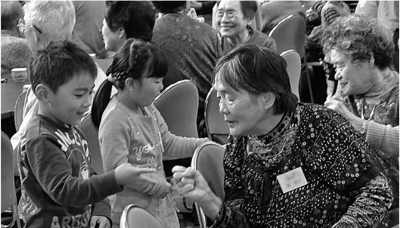
▲園児とのじゃんけん大会で大盛り上がり！