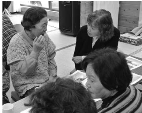
▶「話を聞いてもらって」「ほつ」としませんか？