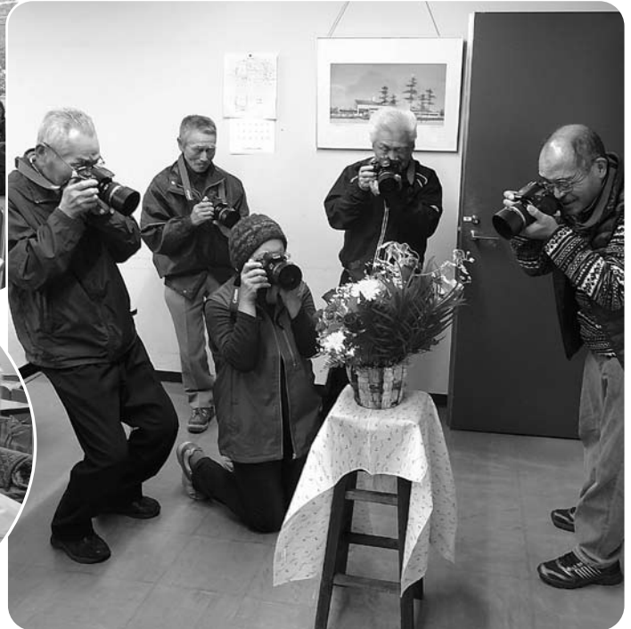
▲初めはドキドキしながらも、だんだん撮影に夢中に！

11月26日、原町生涯学習センターで一眼レフカメラ撮影体験&カレンダーづくり教室を開催し21人が参加しました。 株式会社キャンソンの社会貢献推進課のスタッフから、誰でもプロ並みに撮れるテクニックの説明を受け、その後、参加者は熱心に花や小物など次々に写真に収めていました。 出来上がった写真を見て、参加者たちは「これほんとに自分が撮ったの？」と感嘆の声を上げていました。 撮った写真で、来年のカレンダーをその場でプリントして、お持ち帰りいただきました。