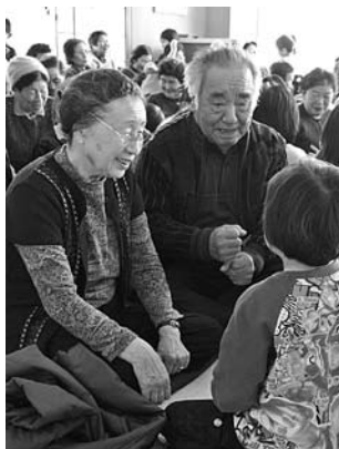
▲昨年度の様子 園児とのふれあいに笑顔

◆対象 現在、鹿島区内にお住まいの高齢者世帯(ともに70歳以上)※仮設住宅、借上げ住宅、災害公営住宅も含む。