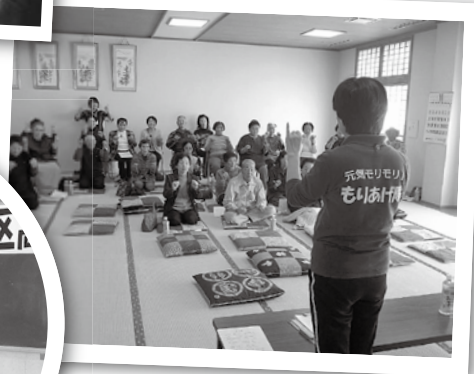
▲原町南地区 (国見町・上町)