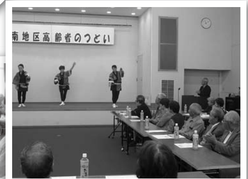
▲原町南地区 (南町・本陣前・橋本町)