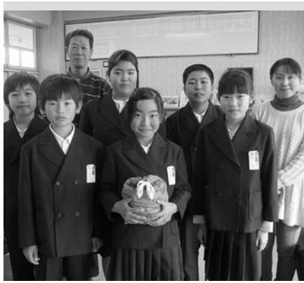
▲石神第一小学校児童会