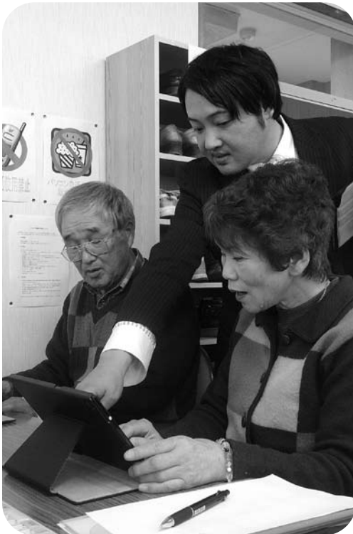
▲タブレット型パソコンにもチャレンジ！