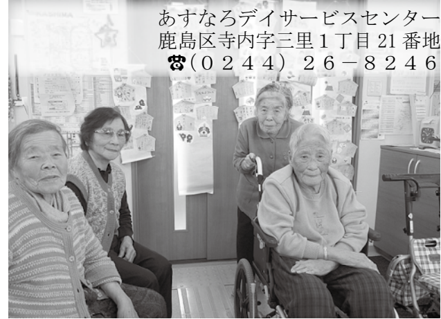
あすなろデイサービスセンター 鹿島区寺内字三里1丁目21番地 ☎(0244)26-8246

2月19日の旧正月にちなみ、利用者の皆さんに願い事を絵馬に書いてもらいました。絵馬を前にして、「今年のお願いごとは何にしようかな」と話し合いながらも、いろいろな願い事が書かれていました。 「自分の家に、早く帰れますように」 「体が、丈夫で長生きができますように」 あすなろデイサービスセンターには、震災の影響により、仮設住宅等にお住まいの方も多く、自宅に帰れるようにという願い書かれる方もいらっしゃいました。 また、中には、こんな願い事もありました。 「職員の笑顔が見れますように」 「デイサービスに来るのが楽しみです」 微笑みながら願い事を書いている皆さんを見て、私たちも笑顔になることができました。