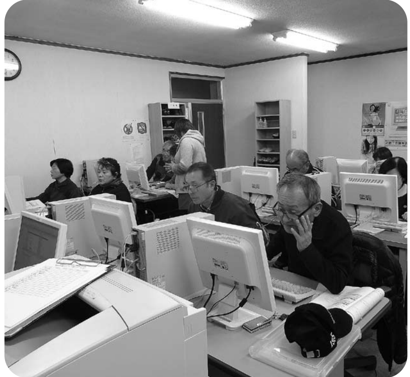
▲皆さん真剣な表情で取り組んでいました

2月2日から6日にかけて、高齢者パソコン教室を開催しました。講師に、ダイコー(株)のご協力をいただき、電源の入れ方から、丁寧に教えていただきました。 参加者の中には、初めてパソコンに触れる方もおり、「パソコンなんて、難しいでしょ?」と言っていた方も、最終日には、「これから家でも勉強して、いろいろ作っていきたい」などと話していました。 また、タブレット型パソコンの使い方も学び、音声機能などを使いながら、「これは便利だね!」と驚きの声を上げていました。