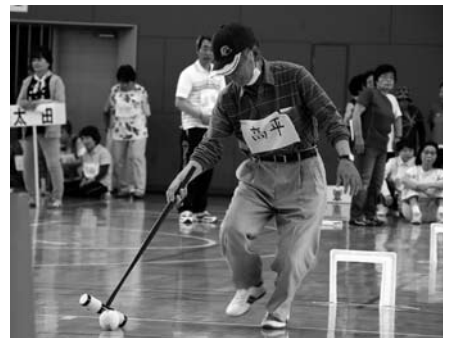
トンネルくぐりの様子

スポーツをとおして、会員同士の親睦が深まったようです。なお、大会の成績は、次のとおりです。