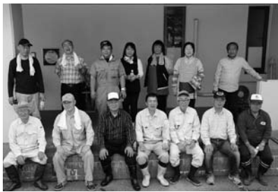
作業を終えた福祉マンたち

6月3日、南相馬市社会福祉協議会理事及び職員15名で原町区福祉会館敷地内の環境整備を行いました。草刈り機、チェーンソー、植木バリカン等を用いた福祉マンの活躍で、敷地内の植木は大分きれいになりました。今後福祉マンの環境整備ボランティア活動は、小高・鹿島サービスセンターでも行う予定です。