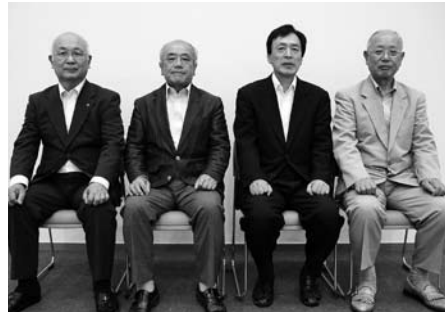
左から廣瀬常務理事、林副会長、西浦会長、西副会長