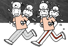
なかよし親子うんどう会、笑顔で記念撮影

6月14日(水)鹿島保健センターで、市内在住の未就学児親子を対象とした「なかよし親子うんどう会」を開催しました。 アンパンマンのお面を被り、プレゼントを目掛けて猛ダッシュ!中には、お母さんにプレゼントしている子もいました。みんなでお尻フリフリダンスをしたり、かけっこをしたり、笑顔溢れるひとときでした。 最後は、ボランティアの皆さんが用意してくれたチーズ入りお豆腐ドーナツをいただき、「おいしい!」と大満足でした。参加していただいた皆さん、ありがとうございました。