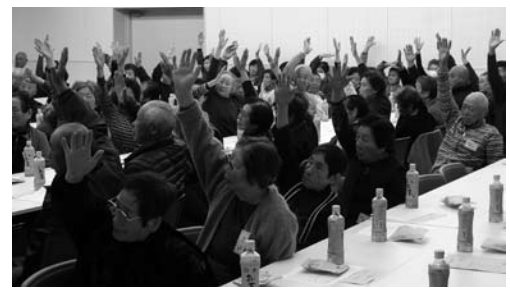
元氣モリモリもりあげ体操！

運営には、原町ボランティア連絡協議会、原町赤十字奉仕団、各地区の民生委員の皆さんのご協力をいただきました。