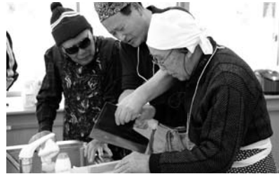
はやぐ食いでなあ

んで、あつという間に平らげられました。午後からは囲碁、将棋などの知力ゲーム、カメラやボウリング、ゴルフなどの体力ゲームの盛り上がりでした。