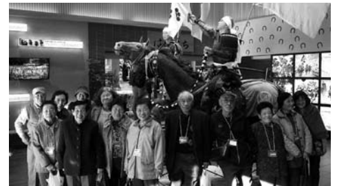
セデッテかしまにて記念撮影

12月19日、鹿島区むつみ荘にて、「原町区被災者のつどい」を開催しました。原町区の借り上げ住宅、災害・復興公営住宅に入居されている方、再建されている方13人が参加しました。 午前は、植木鉢にデコレーションテープやビーズ等でお好みに装飾して頂きました。それぞれに色使いや貼りに工夫があり、個性あふれる素敵な作品が出来上がりました。装飾した鉢にパンジーの花ポットを入れ完成です！ 午後からは、セデッテかしまへバスで移動し、お買いものへ行きました。民芸品や食材、お土産コーナー等ゆっくりご覧になられていました。今回のつどいで久しぶりの再会を果たした方もおり、話が尽きず交流を楽しまれていました。参加者の皆さんから「楽しかった、またやって欲しい」との声がありました。