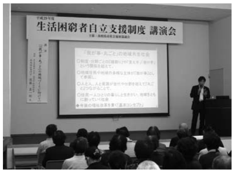
生活困窮者自立支援制度講演会のようす