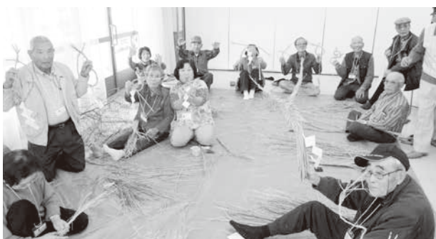
しめ飾り、完成しました！