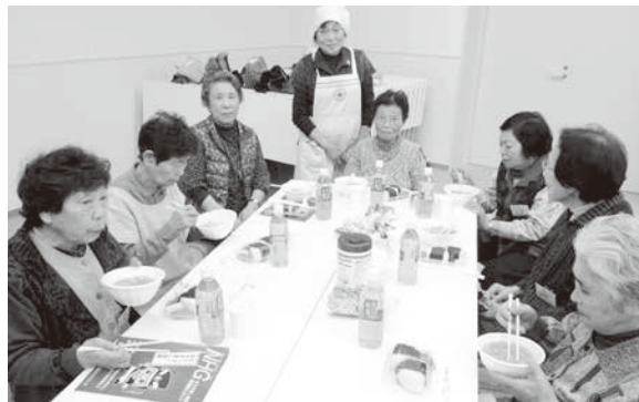
みんなで食べるとおいしいね