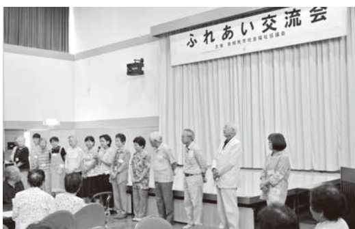
「ふれあい交流会」でのボランティア