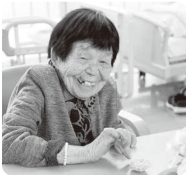
▲4枚重ねてカーネーションができました！