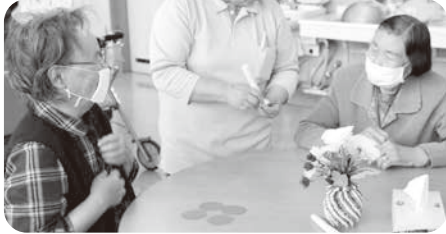
▲マジックペンの先を使って折っていきます。