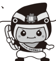
カクニンジャー福くん