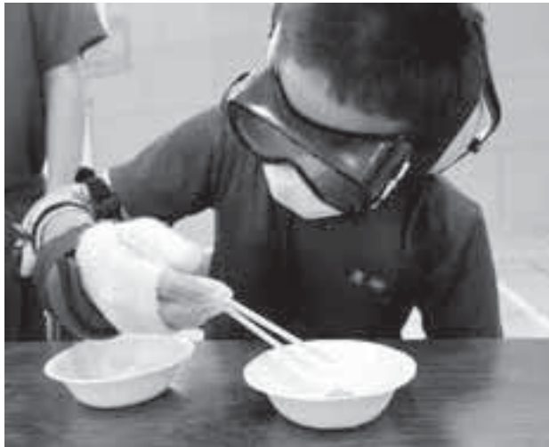
▲日常生活内での動きを学びます