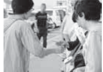
▲昨年の街頭募金の様子