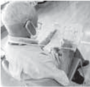
▲手作りビンゴゲームに挑戦中