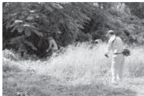
▲原町区福社会館南側の草刈り

8月1日(土)、社協の理事・監事・職員総勢29人で各區福祉サービスセンターの環境整備をしました。小高・鹿島・原町それぞれのサービスセンターで約1時間、敷地内の草刈り・草むしり・除草剤散布・庭木の剪定などに汗を流しました。