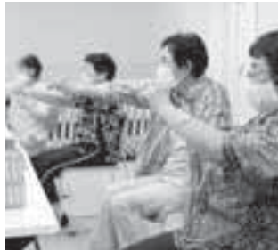
▲軽体操でリフレッシュ!