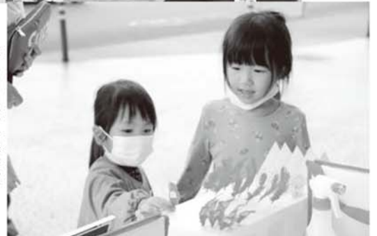
▶赤い羽根街頭募金