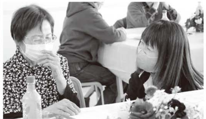
▲アロマの香りがいい匂い♪