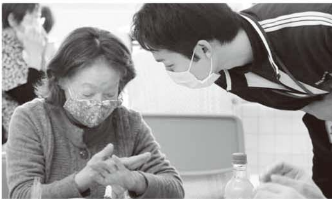
▲ハンドマッサージを実践!