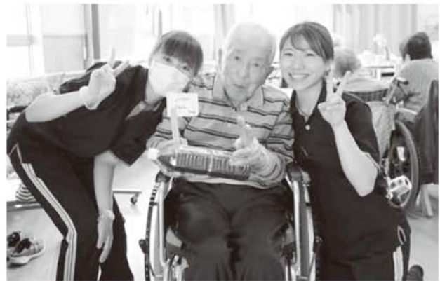
▲ひまわりデイサービスセンター