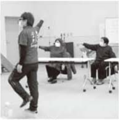
▲楽しく体操！いち・に・いち・に！