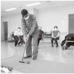
▲一球入魂！スカットボール