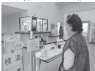
▲参加する前に入り口で検温と消毒をしています★