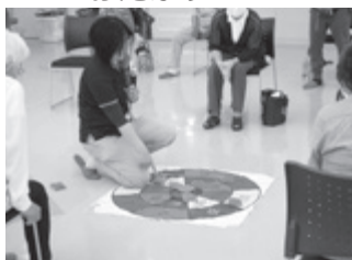
▲みんなで得点を計算して、身体と頭と両方動かしています(△▽)