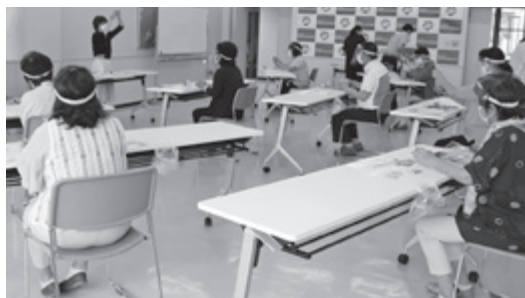
▲ハーブの香りを楽しみながらバスソルト作り