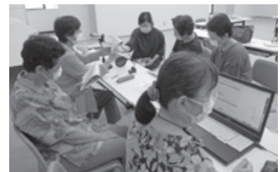
▲実際にマイクを通して声を入れてみます

※声の広報とは…視覚に障がいがあり、広報を読むことが困難な人のために記事をCDに吹き込み送付する事業です。