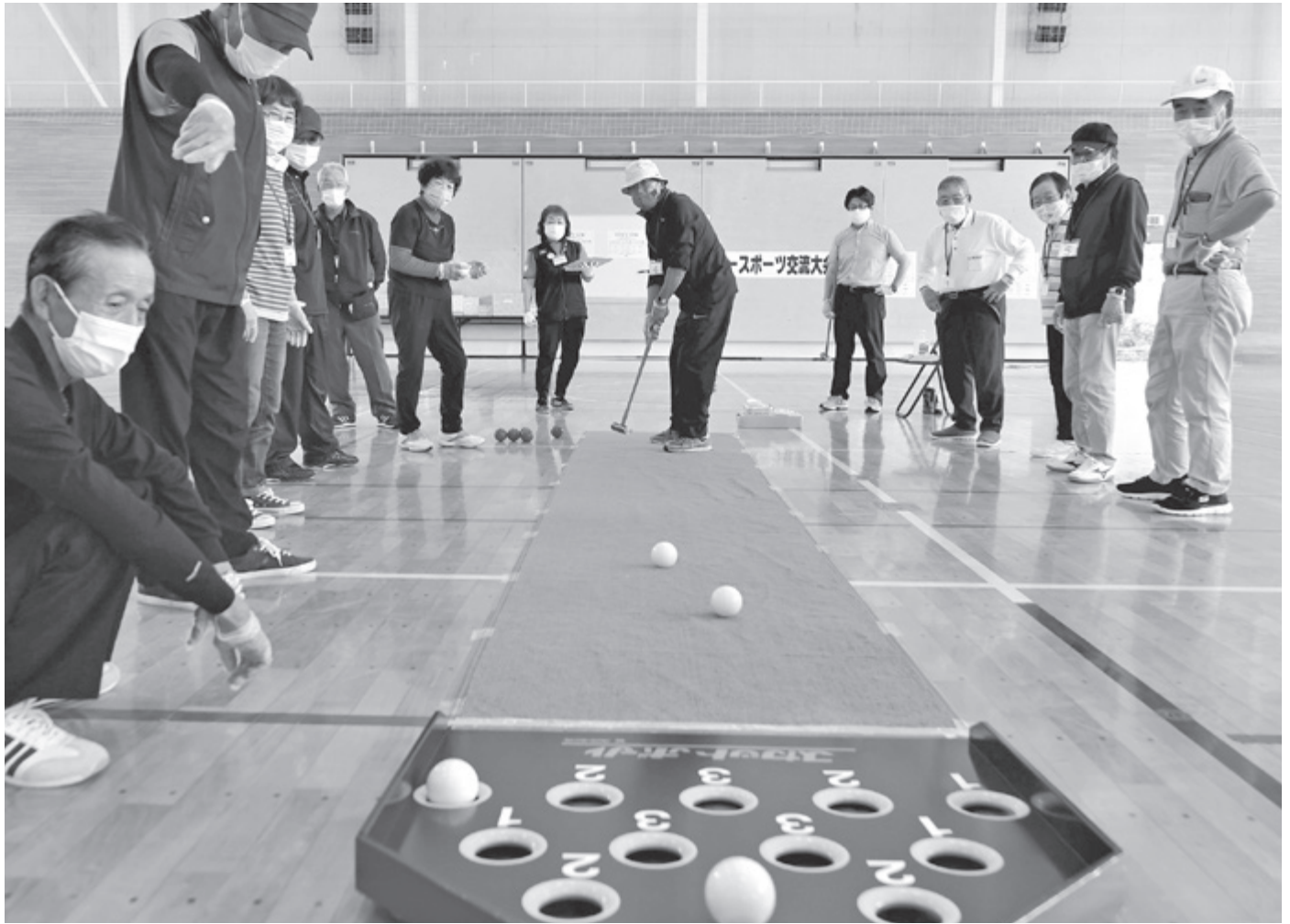
▲高得点を狙え!! (スカットボール)