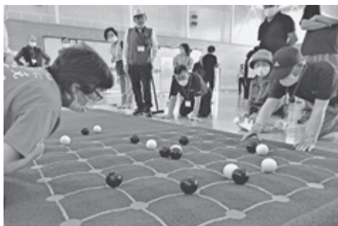
▲囲碁ボールの様子

6月25日、小川町体育館において、南相馬市老人クラブ連合会主催の「第二回ニュースポーツ交流大会」が開催されました。約60人が参加し、熱い戦いが繰り広げられました。 大会では、「囲碁ボール」「スカットボール」「ポッチャ」の三種目を行い、各区ごとに競いました。 できることから始めようと、しっかりと新型コロナウイルス感染症防止対策をしながら、少人数に制限した大会ではありましたが、会場は拍手と笑顔に溢れ、スポーツを通して会員同士の親睦を深めました。 なお、大会の成績は、次のとおりです。