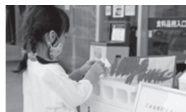
▲ 昨年の街頭募金の様子

災害等準備金として、大規模災害等の発生に対応するための準備金として積み立てています。東日本大震災時には、南相馬市でも大きな支援をいただきました。