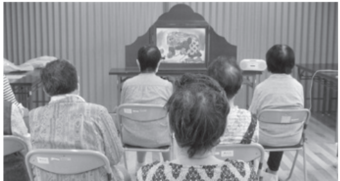
▲ 昔を思い出し紙芝居に聞き入っています！

昔懐かしい桃太郎や浦島太郎のお話と、ユーモラスなへっこき嫁さまのお話では笑いがあふれていました。コロナの影響で自粛生活が続いており、外に出る機会が少なくなっています。感染症対策をとりながら、ほっこりと暖かなひと時となりました。