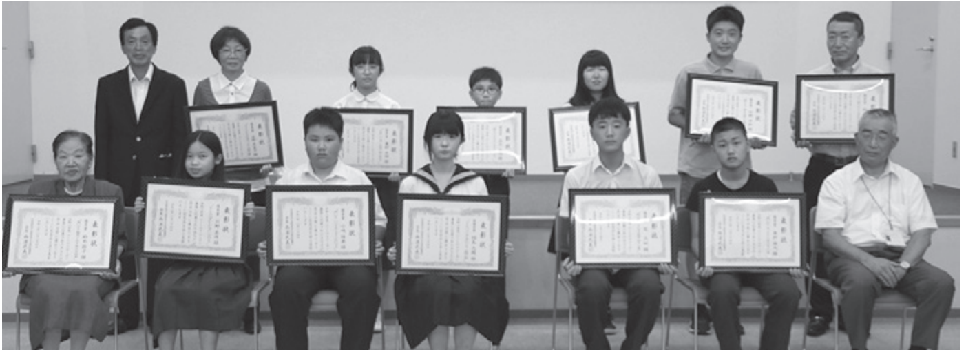
▲受賞された皆さん、おめでとうございます！