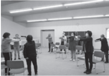
～ヨガ出前講座を受講～ 1年ぶりの方も参加し、楽しくリフレッシュできました!(^^)!