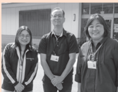
▲ 小高地域包括支援センター

地域包括支援センターは、地域の高齢者の暮らしを支える総合相談窓口です。市内には4つの地域包括支援センターがあり、当社協では、小高地域・原町西地域・鹿島地域を担当しています。医療・福祉の専門職が配置され、計16名の職員で相談対応を行っています。