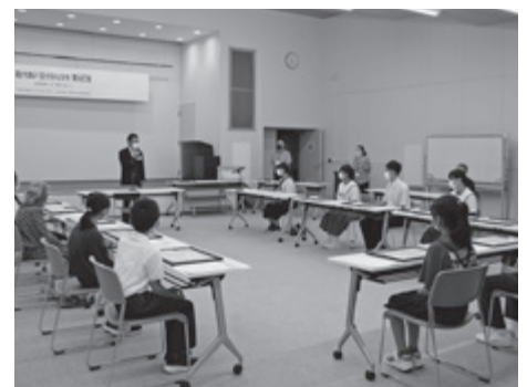
▲ ふくしのスローガン表彰式