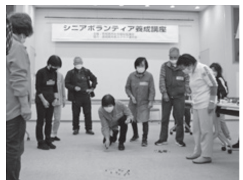
▲ シニアボランティア養成講座