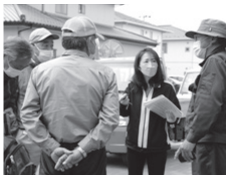
▲ 災害ボランティアセンター