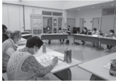
～こころの健康づくり出前講座を受講～ 健康生活は、毎日できるところからコツコツと(*^^)v