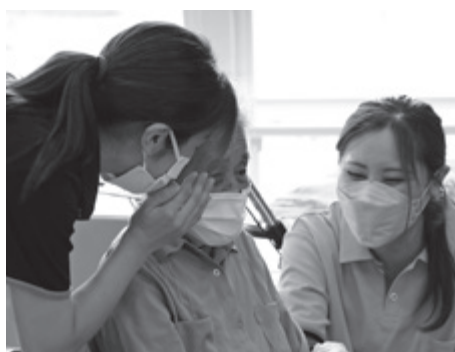
▲ ひまわりデイサービス