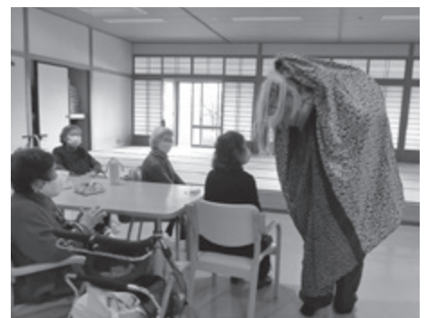
▲ あすなろデイサービス