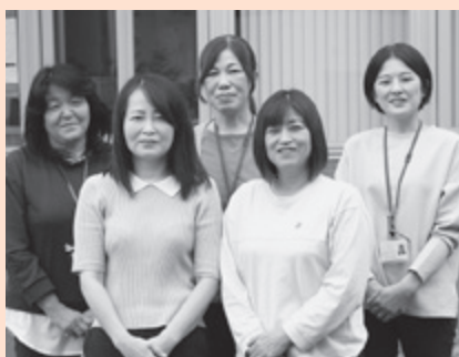
▲ 鹿島地域包括支援センター

どうぞ、地域の皆さまの変わらぬご支援、ご協力をお願い申し上げ、会長就任の挨拶といたします。