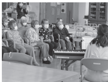
▲ すみれデイサービス