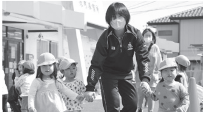
▲ スプリングショートボランティアスクール