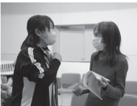
▲ 地域包括支援センター