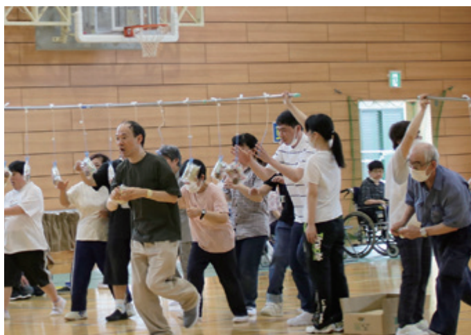
▲ 新種目「お菓子の木」