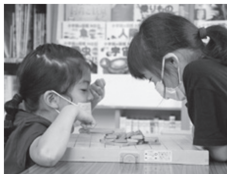
▲ 仲町児童センター