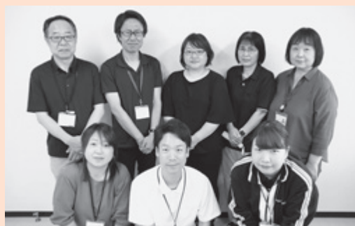
▲ 原町西地域包括支援センター

そんな時には、お住まいの地区担当の地域包括支援センターにご相談ください。皆さんが安心して地域で暮らし続けられるように私たちがサポートさせていただきます!!