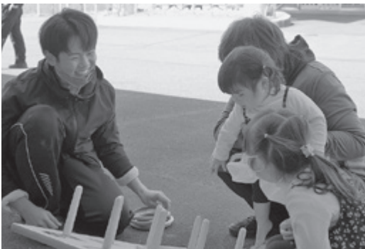
▲ なかよし親子子ども祭り