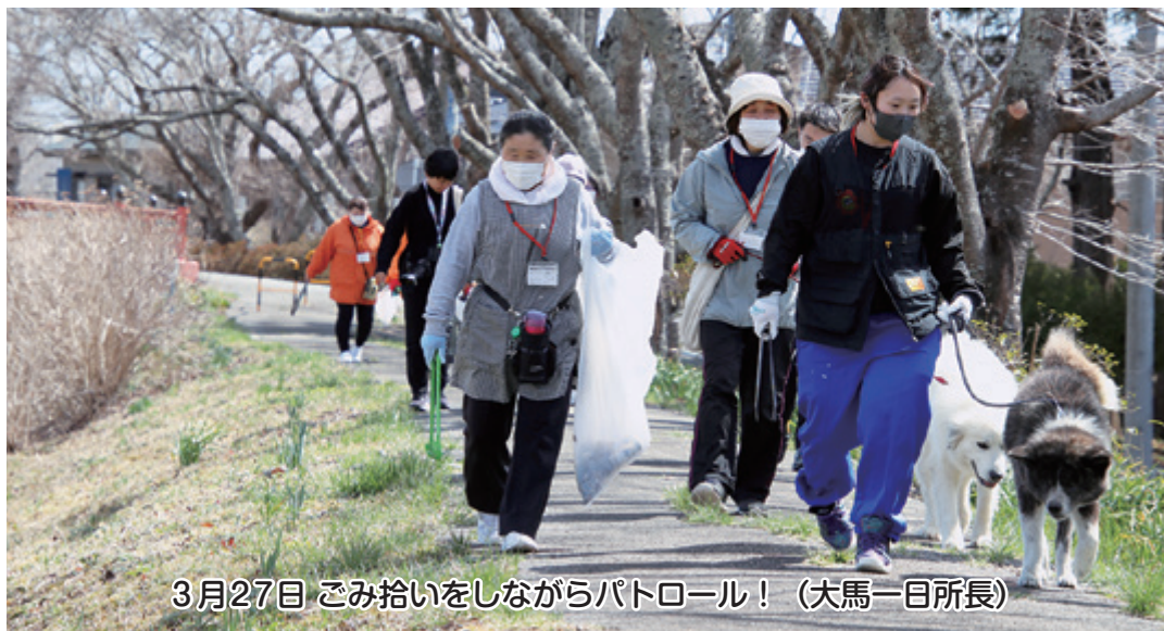
3月27日 ごみ拾いをしながらパトロール！(大馬一日所長)

いつも社協だよりオレンジハートをご愛読いただきありがとうございます。 令和6年度より、隔月(偶数月)発行となりますので、ご理解の程よろしくお願いいたします。