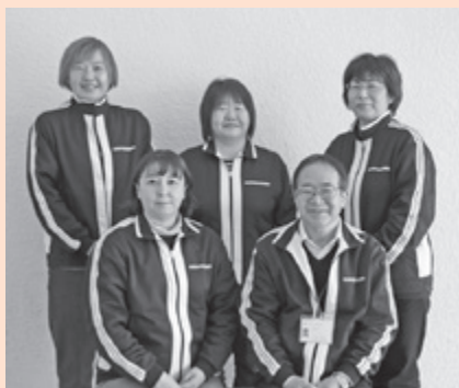
▲ 仲町児童センター

仲町児童センターの主な業務は放課後児童クラブの運営です。令和4年度からは原町第三小学校の子どもたちを受入れ、放課後子どもたちは社協のバスで登館します。職員はバスに添乗して子どもたちを迎えに行き、子どもたちが楽しく安心・安全に過ごせるよう支援しています。また、平日の午前中は施設の貸出しも行っており、現在は地域の人たちが健康サロンなどで利用しています。貸館をご希望の方はお気軽にお問い合わせください。