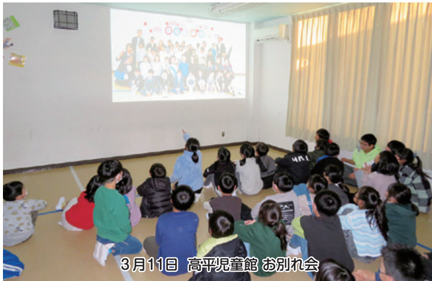
3月11日 高平児童館 お別れ会

小高区福祉サービスセンター (地域福祉課) 44-5970 鹿島区福祉サービスセンター (地域福祉課) 46-5354 原町区福祉サービスセンター (代表) 24-3415 (総務課・地域福祉課・生活支援相談室) 小高包括 44-1700 鹿島包括 46-4600 原町西包括 25-3329 高平児童館 24-3557 あすなろデザインサービスセンター 44-1330 鹿島区居宅介護支援事業 46-1777 原町区居宅介護支援事業所 24-3418 仲町児童センター 22-1803 すみれデザインサービスセンター 46-1277 ひまわりデザインサービスセンター 46-1770 訪問介護事業所 24-3870