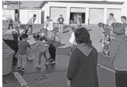
▲ 各団体と連携し、自然災害に備えます (イザ!カエルキャラバン)