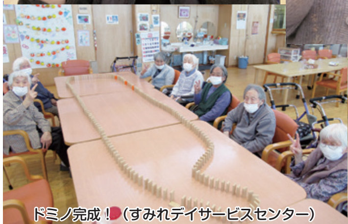
ドミノ完成！(すみれデイサービスセンター)