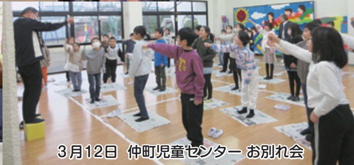
3月12日 仲町児童センター お別れ会