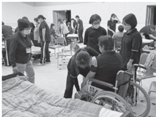
▲ 質の高い介護技術を目指します