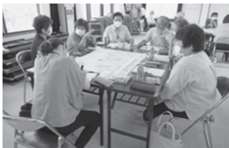
▲ 地域住民との懇談により、地域の課題を探ります (地域福祉懇談会)