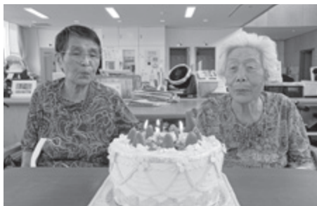
▲ 特色あるデイサービスセンターを目指します (誕生日会のようす)