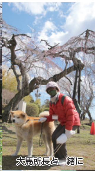
大馬所長と一緒に