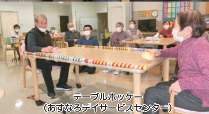
テーブルホッケー (あすなるデイサービスセンター)

この広報誌は皆様から寄せられた「社協会費」・「赤い羽根共同募金配分金」が活用されています