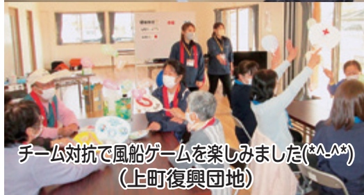
チーム対抗で風船ゲームを楽しみました(*^_^*) (上町復興団地)