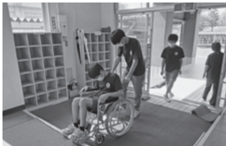
▲ 障がい者への理解、車いす体験 (福祉体験学習)