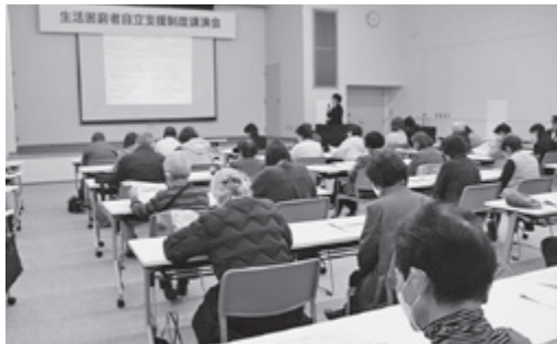
▲ さまざまな講演会を実施します