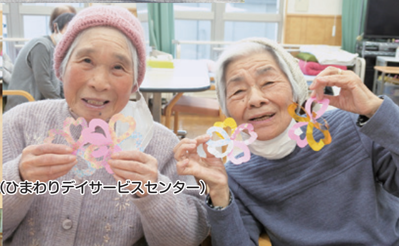
桜の花づくり(ひまわりデイサービスセンター)