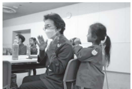
▲ 市民参加による地域福祉事業を展開します