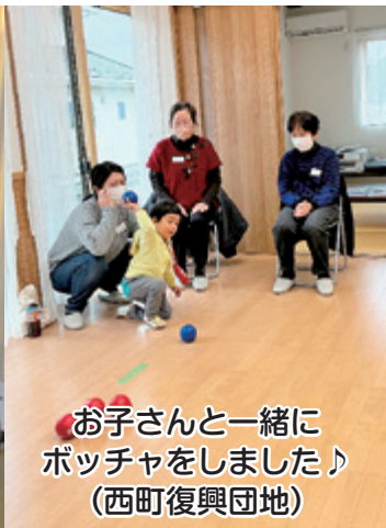
お子さんと一緒に ポッチャをしました♪ (西町復興団地)