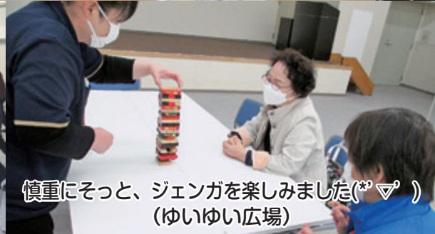
慎重にそと、ジェンガを楽しみました(*^▽^*) (ゆいゆい広場)