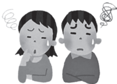
▲ あなたの悩みごと・困りごとをご相談ください