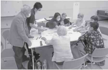
▲ 地域住民との懇談により地域の課題を探ります