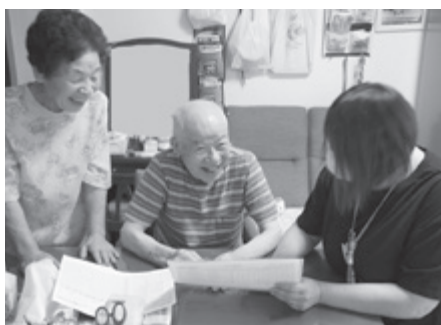
▲ 自立した生活を送るためにサービス調整をします(居宅介護支援事業所)