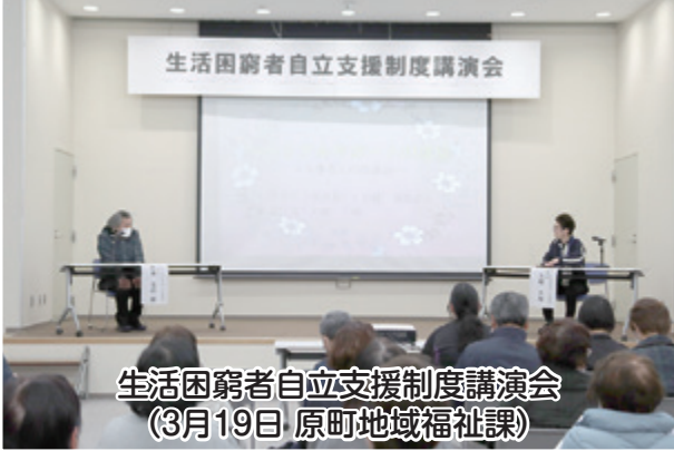
生活困窮者自立支援制度講演会 (3月19日 原町地域福祉課)