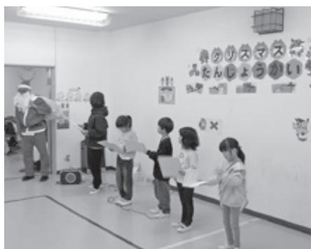
▲ 児童の安心・安全な居場所を提供します(児童館・児童センター)