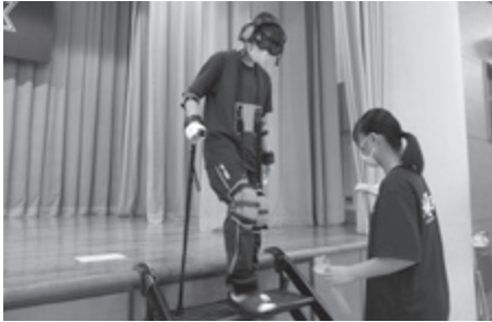
▲ 障がい者への理解促進を図ります (福祉体験学習)