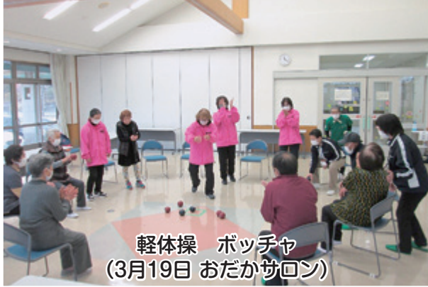
軽体操 ポッチャ (3月19日 おだかサロン)