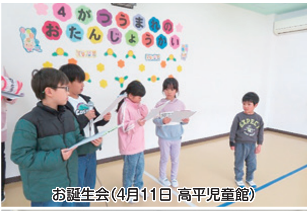
お誕生会(4月11日 高平児童館)