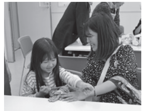
▲ 各団体と連携し、自然災害に備えます(イザ!カエルキャラバン)