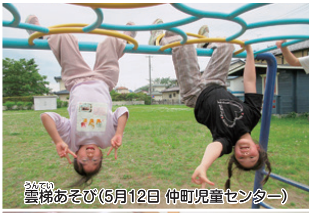
雲梯あそび(5月12日 仲町児童センター)

小高区福祉サービスセンター (地域福祉課) 44-5970 鹿島区福祉サービスセンター (地域福祉課) 46-5354 原町区福祉サービスセンター (代表) 24-3415 (総務課・地域福祉課・生活支援相談室) 小高包括 44-1700 鹿島包括 46-4600 原町西包括 25-3329 高平児童館 24-3557 あすなるデイサービスセンター 44-1330 ひまわりデイサービスセンター 46-1770 居宅介護支援事業所 24-3418 仲町児童センター 22-1803 すみれデイサービスセンター 46-1277 訪問介護事業所 24-3870