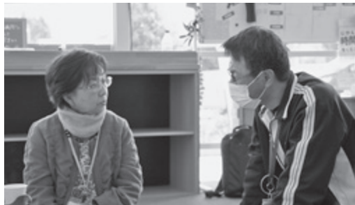
▲ 高齢者を支える総合相談窓口として支援します(地域包括支援センター)