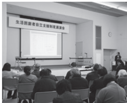
▲ 福祉に関するさまざまな講演会を実施します