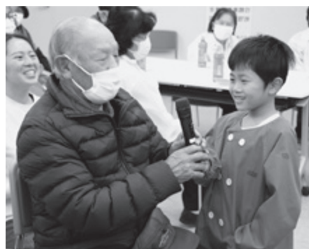
▲ 市民参加による地域福祉事業を展開します(高齢者ふれあい交流会)