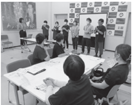
▲ 研修で介護職員の知識の向上を図ります