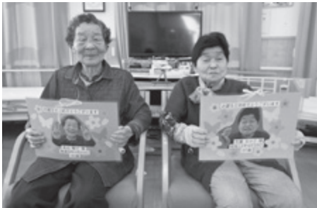
▲ 特色あるデイサービスセンターを目指します(誕生日会のようす)