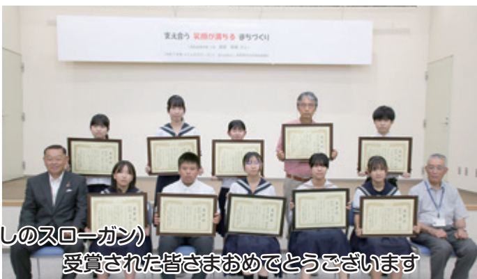
受賞された皆さまおめでとうございます