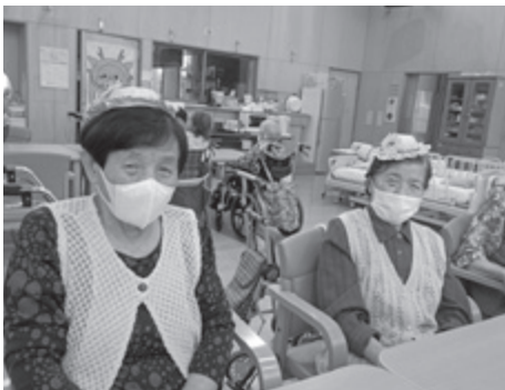
▲ 麦わら帽子工作(すみれデイサービスセンター)