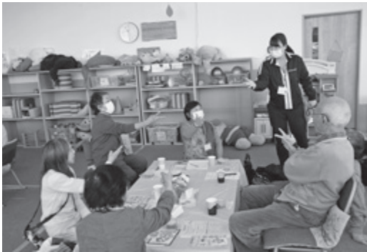
▲ 家族介護者交流事業(地域包括支援センター)