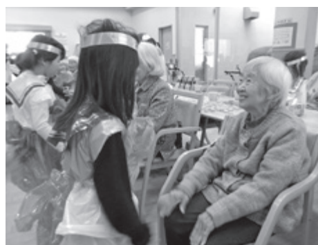
▲ かしま保育園の子たちとの交流(ひまわりデイサービスセンター)