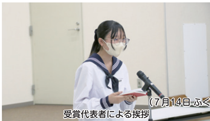
(7月14日 ふくしのスローガン) 受賞代表者による挨拶