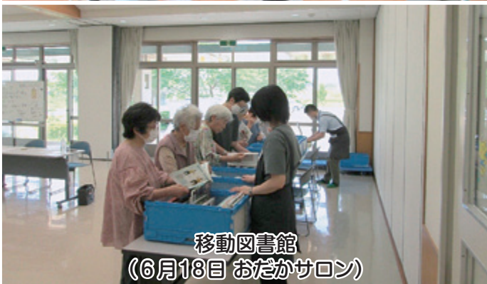
移動図書館 (6月18日 おだかサロン)