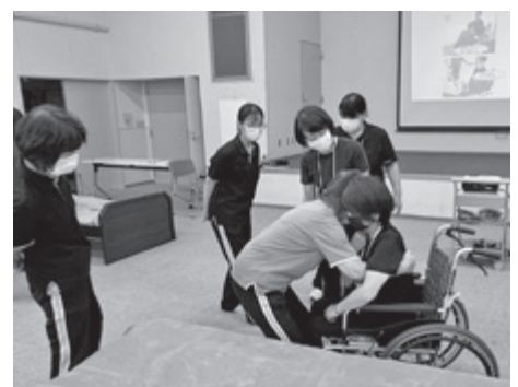
▲ 研修会の様子(訪問介護事業所)