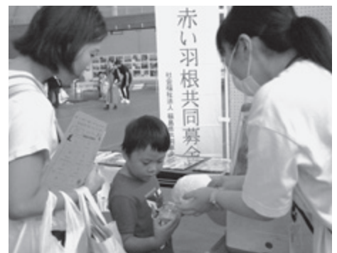
▲ ボランティアフェスティバル