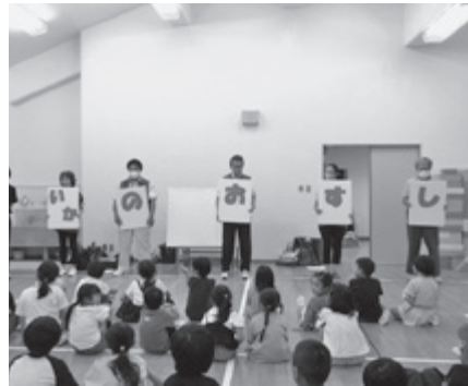
▲ 防犯教室(仲町児童センター)