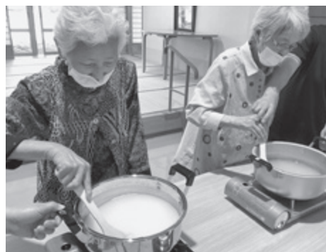
▲ 水まんじゅう作り(あすなろデイサービスセンター)