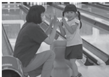
▲子どもニコニコ元氣塾