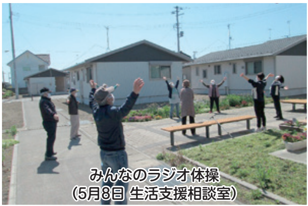
みんなのラジオ体操 (5月8日 生活支援相談室)