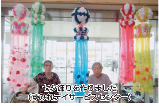
七夕飾りを作りました (すみれデイサービスセンター)

デイサービスセンター 統合のお知らせ 本会では鹿島区において「ひまわりデイサービスセンター」と「すみれデイサービスセンター」の二つの施設を運営しておりますが、ご利用者数の減少や介護人材不足、施設設備の老朽化等のさまざまな問題を抱えております。このようなことから、安定的にサービスを提供させていただくために、二つのデイサービスセンターを統合し、月々土曜日の週6日営業する運びとなりました。 ご利用者やご家族、関係事業所の皆さまには、ご不便やお手数をおかけいたしますが、役員一同工夫を凝らし、より良いサービスの提供に努めてまいりますので、ご理解のうえ変わらぬご愛顧をよろしくお願いいたします。 統合日 令和7年10月1日 統合先 すみれデイサービスセンター (鹿島区西町2-165) ※ひまわりデイサービスセンターは当面の間、休止とします。 営業日 月々土曜日(週6日) ※現在月々金曜日(週5日) 利用定員 1日45名