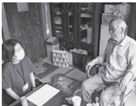
▲ サービス調整のための訪問(居宅介護支援事業所)