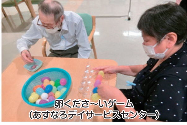
卵くださ〜いゲーム (あすなるデイサービスセンター)