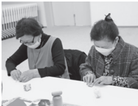
▲ ゆいゆい広場(生活支援相談室)