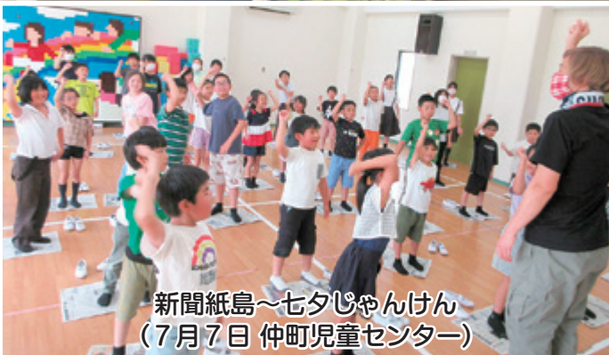
新聞紙島～七夕じゃんけん (7月7日 仲町児童センター)