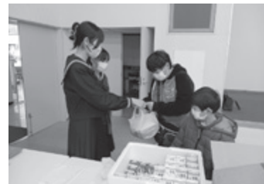
▲みんなの食堂ゆるっと