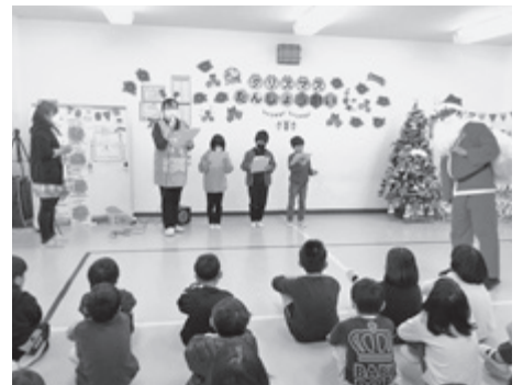
▲ クリスマス誕生会(高平児童館)