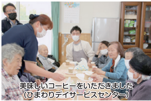
美味しいコーヒーをいただきました (ひまわりデイサービスセンター)