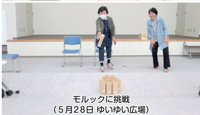
モルックに挑戦 (5月28日 ゆいゆい広場)