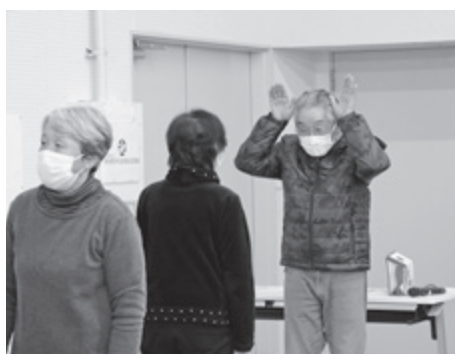
▲ ふれあいサロン交流会