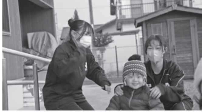
▲ ウィンターショートボランティアスクール