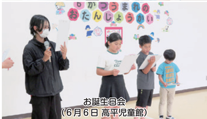
お誕生日会 (6月6日 高平児童館)