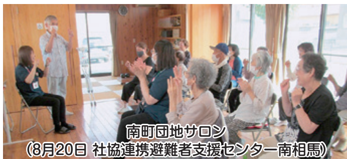
南町団地サロン (8月20日 社協連携避難者支援センター南相馬)