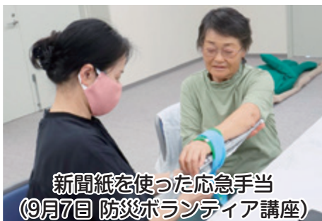
新聞紙を使った応急手当 (9月7日 防災ボランティア講座)