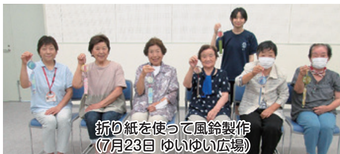
折り紙を使って風鈴製作 (7月23日 ゆいゆい広場)