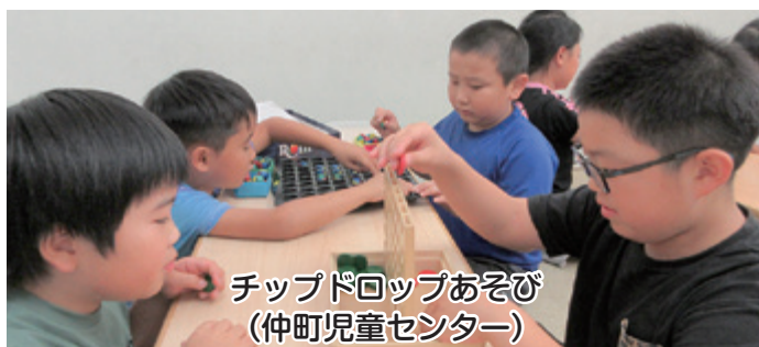
チップドロップあそび (仲町児童センター)