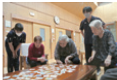
グループホームたんぼぼ