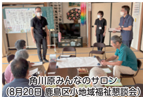
角川原みんなのサロン (8月20日 鹿島区小地域福祉懇談会)