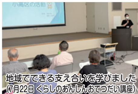
地域のできる支え合いを学びました (7月22日 暮らしのあんしんおてつだい講座)