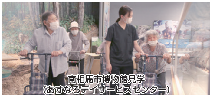
南相馬市博物館見学 (あすなるデイサービスセンター)