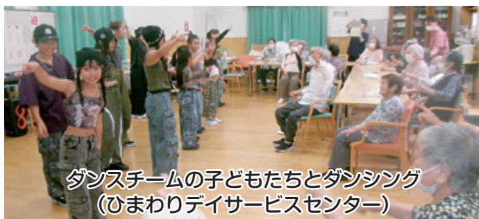
ダンスチームの子どもたちとダンシング (ひまわりデイサービスセンター)