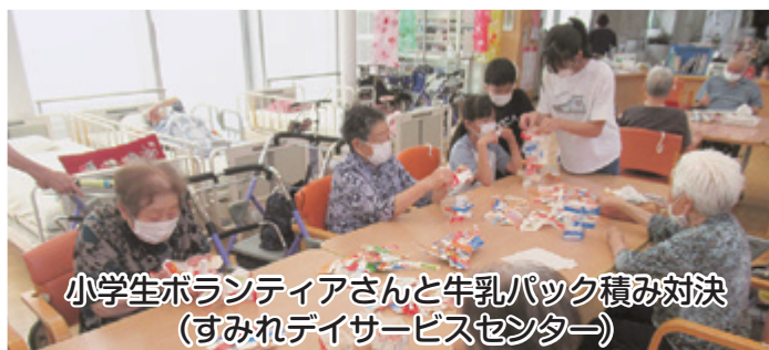
小学生ボランティアさんと牛乳パック積み対決 (すみれデイサービスセンター)