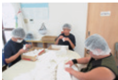
はらまちびりワークセンター