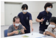
社協生活支援相談室