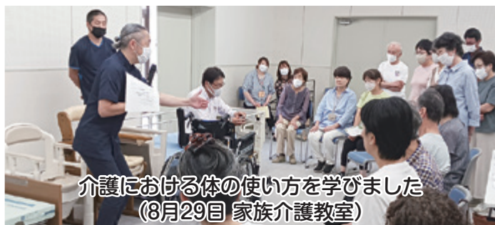
介護における体の使い方を学びました (8月29日 家族介護教室)