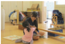
小高認定こども園