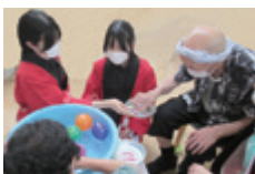
デイサービスセンターしゃりん梅