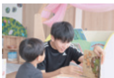
はらまち認定こども園 聖桜