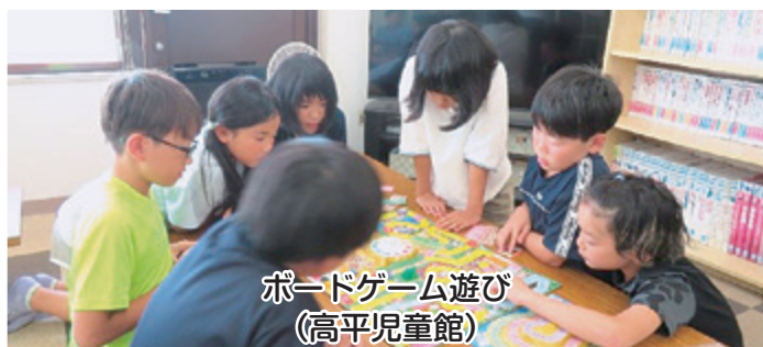
ボードゲーム遊び (高平児童館)