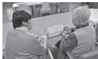
▲グループホームたんぽぽ