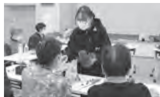
▲社協 生活支援相談室