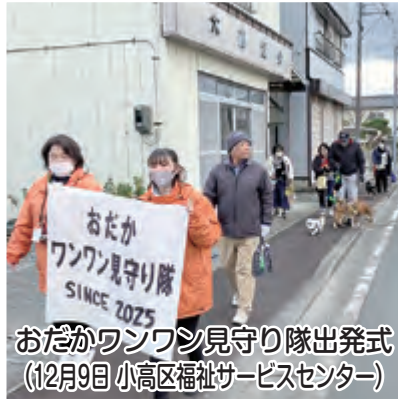
おだかワンワン見守り隊出発式 (12月9日 小高区福祉サービスセンター)