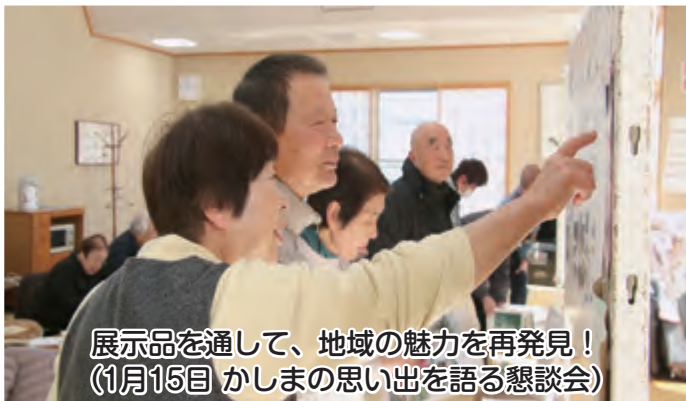
展示品を通して、地域の魅力を再発見！ (1月15日 かしまの思い出を語る懇談会)