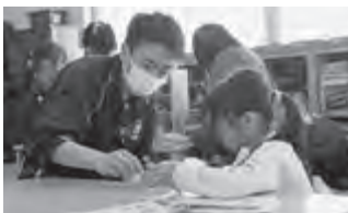
▲上町児童センター