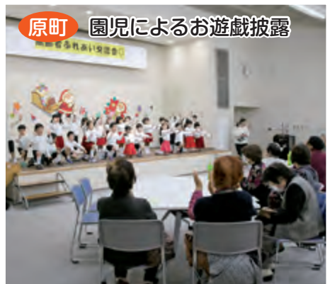
原町 園児によるお遊戯披露