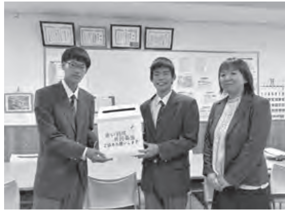
▲ 相馬支援学校による募金贈呈