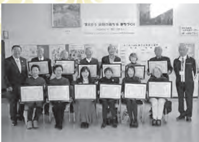
▲12月4日に表彰伝達式を行いました

10月23日に、会津風雅堂において「第79回福島県社会福祉大会」が開催され、各種表彰を受けられました。受賞された皆さま、誠におめでとうございます。なお、受賞者については、本会ホームページに掲載しておりますので、ぜひご覧ください。