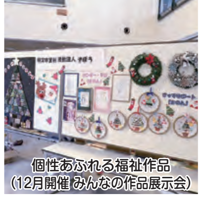
個性あふれる福祉作品 (12月開催 みんなの作品展示会)