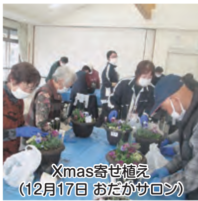
Xmas寄せ植え (12月17日 おだかサロン)

小高区福祉サービスセンター(地域福祉課) 44-5970 小高包括 44-1700 あすなろなデイサービスセンター 44-1330 仲町児童センター 22-1803 鹿島区福祉サービスセンター(地域福祉課) 46-5354 鹿島包括 46-4600 すみれデイサービスセンター 46-1277 高平児童館 24-3557 原町区福祉サービスセンター(代表) 24-3415 原町西包括 25-3329 居宅介護支援事業所 24-3418 訪問介護事業所 24-3870 (総務課・地域福祉課・生活支援相談室)