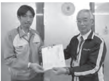
▲ 歳末たすけあい募金の贈呈 (ミネベアパワーデバイス労働組合)

原町聖愛こども園 聖愛ちいろば園 南相馬市社会福祉協議会 および社協事業内募金箱