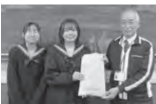
▲ 原町高校による募金贈呈