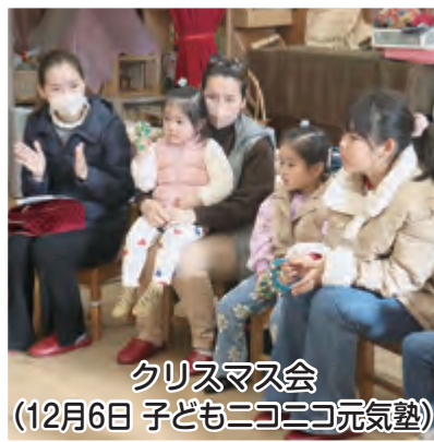
クリスマス会 (12月6日 子どもニコニコ元気塾)