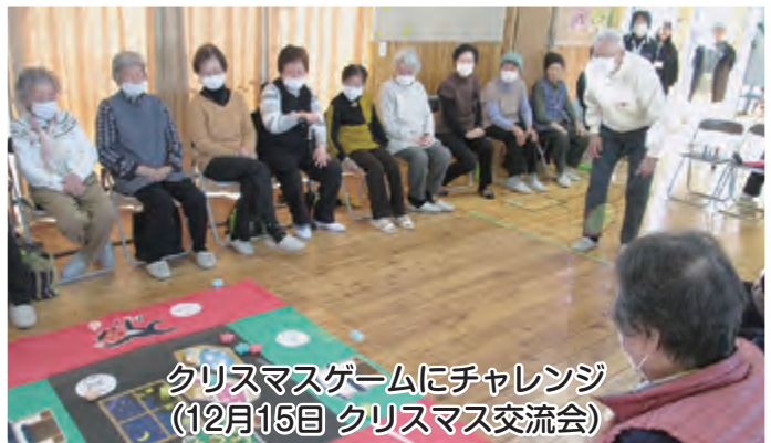
クリスマスゲームにチャレンジ (12月15日 クリスマス交流会)