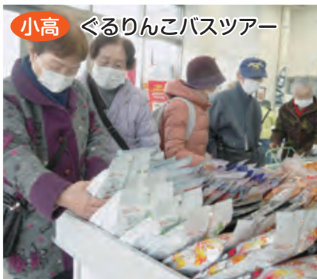
小高 ぐるりんこバスツアー