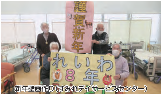
新年壁画作り(すみれデイサービスセンター)