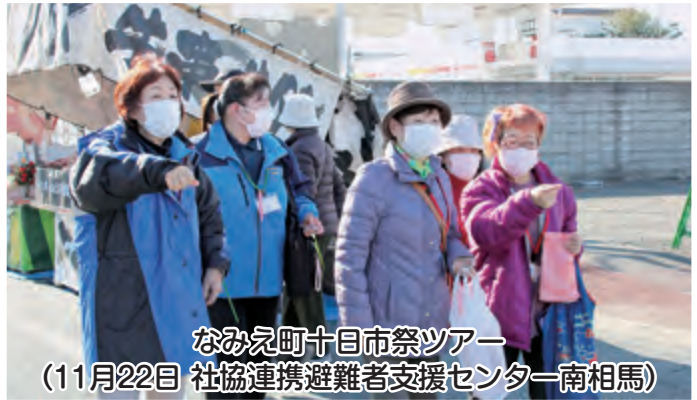
なみえ町十日市祭ツアー (11月22日 社協連携避難者支援センター南相馬)