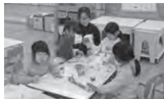
▲小高認定こども園