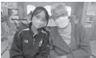
▲すみれデイサービスセンター