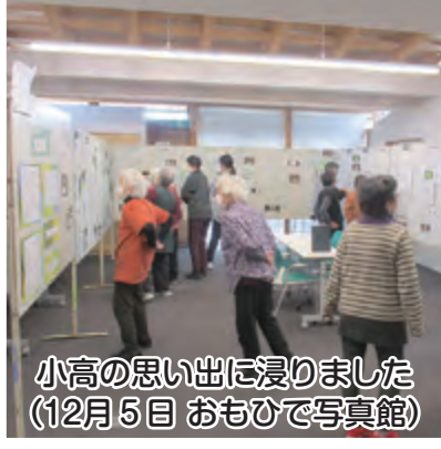
小高の思い出に浸りました (12月5日 おもひで写真館)