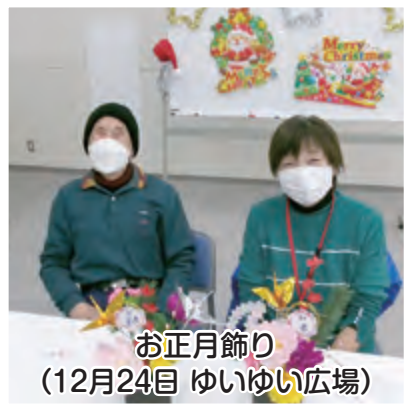
お正月飾り (12月24日 ゆいゆい広場)