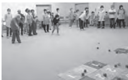
◀ さまざまな事業に共募配分金が活用されています (ふれあいサロン交流会)

上太田こびつとサロン いつでもどこでも歩こう会 下北ほほえみサロン みなさん(南三)にこにこサロン 西町フレンド会 そよ風会 ほほえみサロン 上栢窪サロン会 角川原みんなのサロン 石神民生委員児童委員協議会 小谷スポーツクラブ はつらつ北原 にこにこ元気サロン 信田沢ハッピー元気会 いきいき元気会 ここに健康サロン ハッピーサロン ベリーの会 大木戸一ふれあいサロン 浮田サロン「絆会」 旭ふれあいサロン さくらんぼ会 牛来ニコニコサロン 小屋木サロン ゆうこスタジオ 高たのしみ会 大町きらきらサロン 中太田スマイル ひばりいきいきサロン えがおサロン かしま区シルバークラブ 下高平サロンさくら会 元気になってみっぺの会