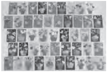
▲シクラメンの壁飾り