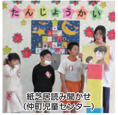
紙芝居読み聞かせ (仲町児童センター)

鹿島地域包括支援センター事務所移転 令和8年1月1日より事務所を左記に移転しました。移転先は、旧事務所の東隣の建物となります。 移転先住所 鹿島区西町2-1-17 (むつみ荘内)