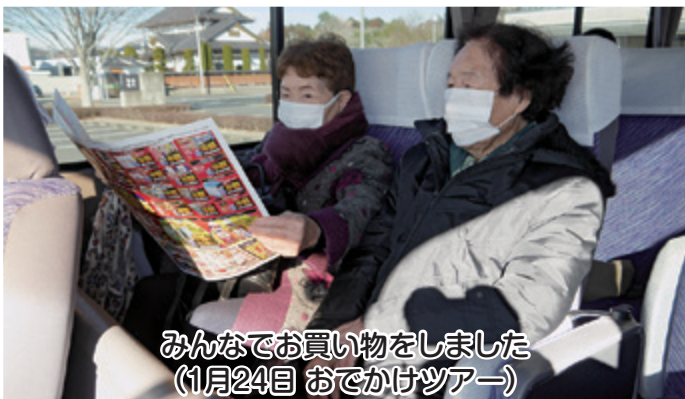
みんなで買い物をしました (1月24日 おでかけツアー)