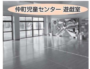
仲町児童センター 遊戯室