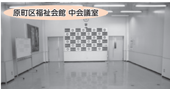
原町区福祉会館 中会議室