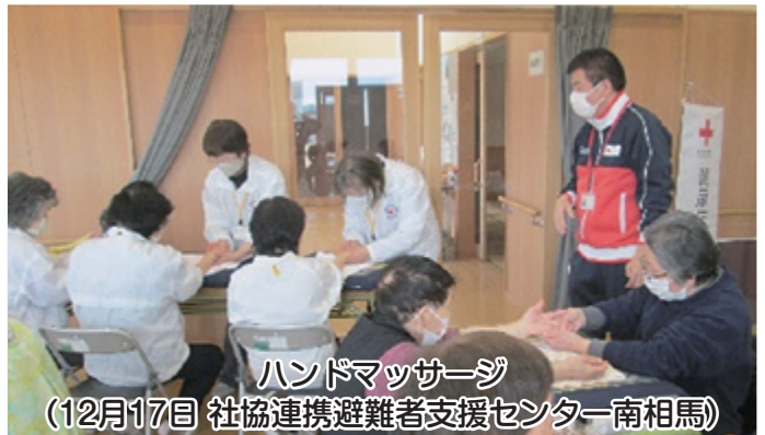
ハンドマッサージ (12月17日 社協連携避難者支援センター南相馬)