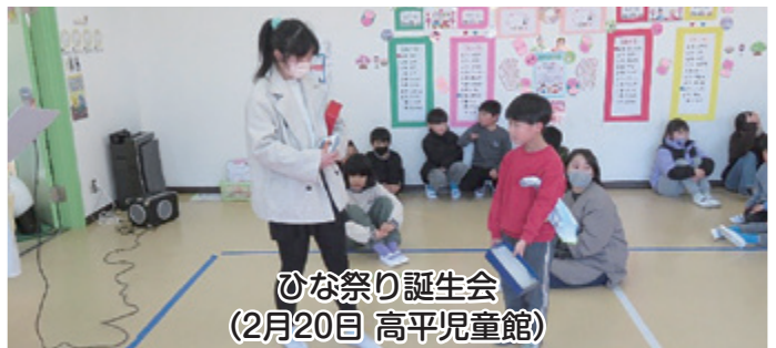
ひな祭り誕生会 (2月20日 高平児童館)