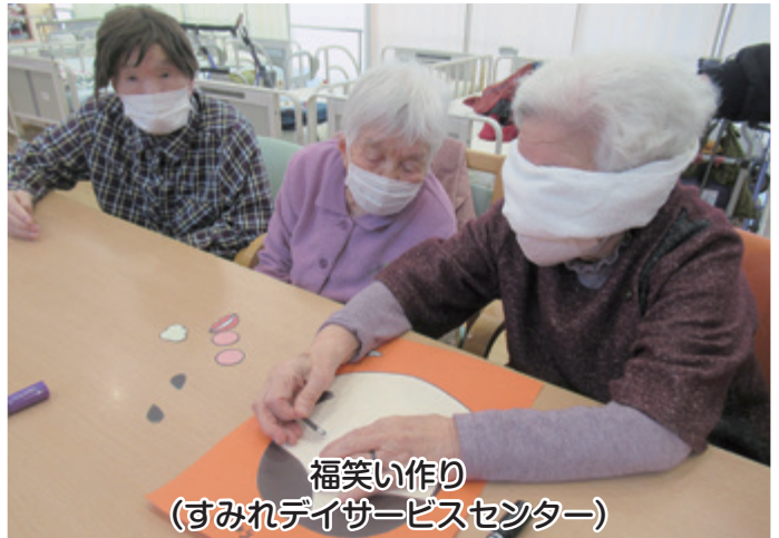
福笑い作り (すみれデイサービスセンター)