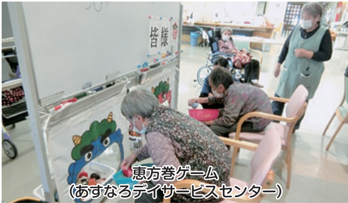
恵方巻ゲーム (あすなるデイサービスセンター)