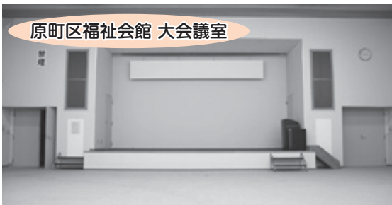
原町区福祉会館 大会議室