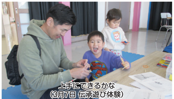
上手にできるかな (3月7日 伝承遊び体験)