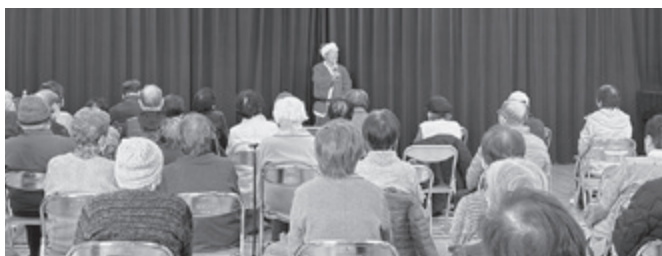
▲みなみ地区福祉委員会