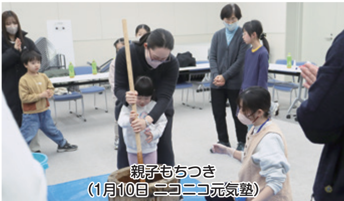
親子もちつき (1月10日 ニコニコ元気塾)