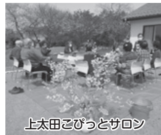
上太田こびっとサロン