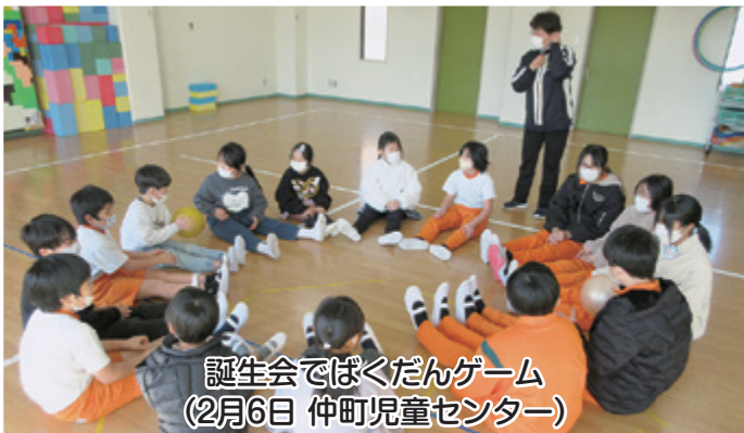
誕生会でばくだんゲーム (2月6日 仲町児童センター)